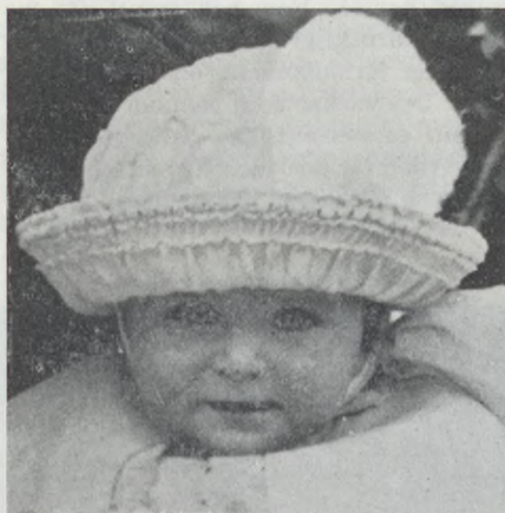
Det första kända tillfälle vid vilket Kuratorn studerade gatulivet.

"I Stockholm har man nu haft en uppsökande kurativ verksamhet under i det närmaste 5 år. Verksamheten är helt fristående i den bemärkelsen att man inte är hänvisad till att samarbeta med något speciellt organ utan väljer att samarbeta