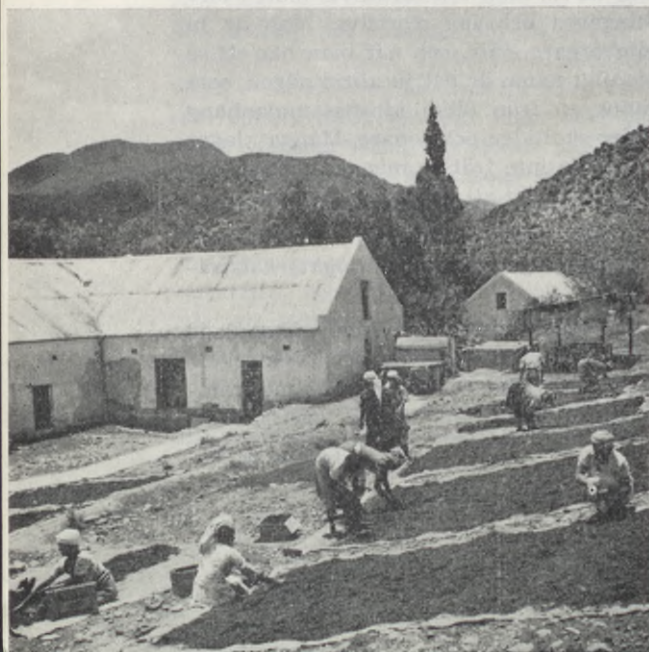
Torkning av tobaksblad — i ett förtjusande landskap.

Än en gång for vi i slingrande buktar över bergen, denna gång till George, en liten idyllisk stad en mil från kusten. Omgivningarna var un-