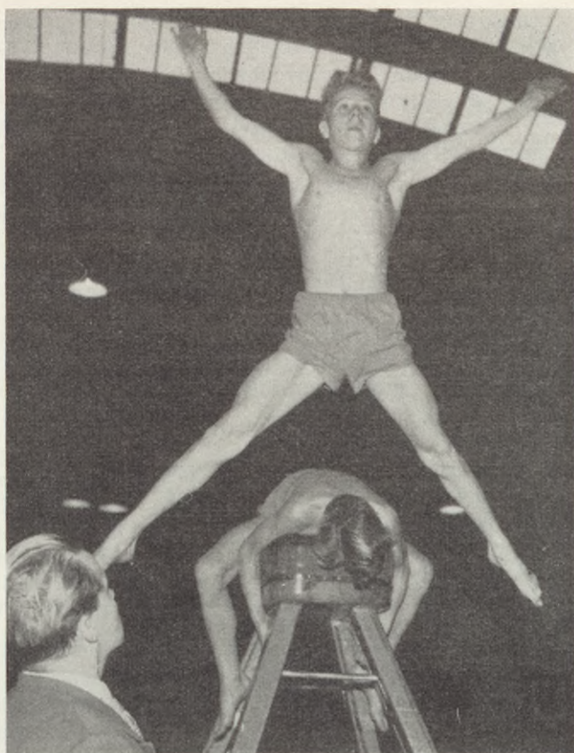
Fysisk fostran måste vara en väsentlig del av ungdomens fostran.

förbundets expedition, Järntorget 2, med exp.-tid kl. 17—19 och tel. 14 64 64 eller 14 68 24.