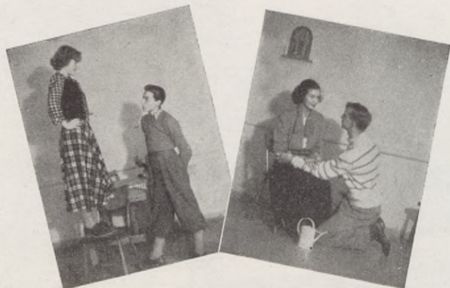
Från en teatergrupp.

För dem som kan sjunga har vi en särskild kör: »Sångarringen».