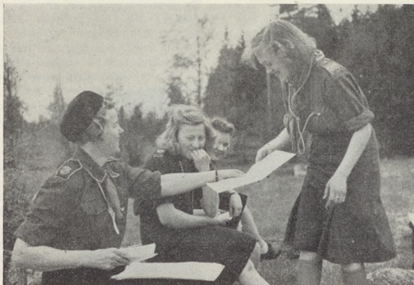
Fritidsutbildning och kamratskap.