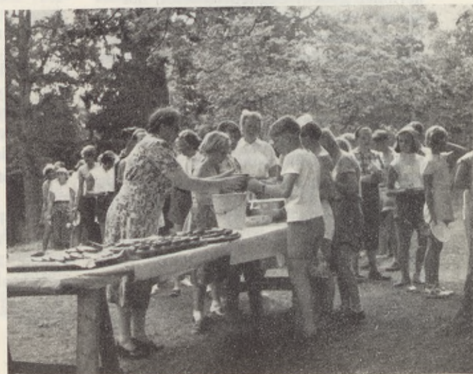
Linnékyrkans juniorer på sommarläger vid Stenungsön.