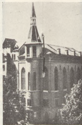
Linnékyrkan Linnégatan 35 Göteborg

6 flockar med 126 medlemmar på fyra olika platser i stan.