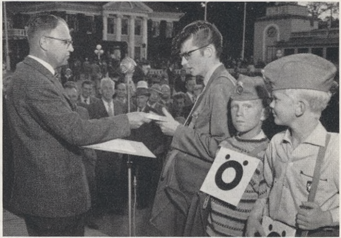
Pigga guldhedspojkar i postverkets tjänst på Liseberg.