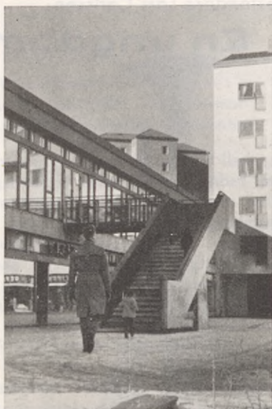
Omslagsbilden: Markant profil i ny stadsdel — centrumbyggnaden i Högsbotorp med sin originella entré och trappa