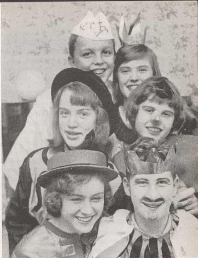
Här ser vi ett piggt gäng från Högsbotorps ungdomsgårds teatergrupp.