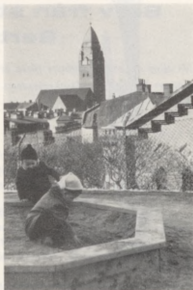
Omslagsbilden: Masthugget — stadsdel med markant profil och — dessvärre — små möjligheter för barn och ungdom.