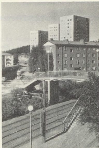
Omslagsbilden: En stad i staden: Kortedala med sina nära 25.000 invånare och tjuisigt läge.

örörda och ursprungliga gör sig alltmera märkbar.