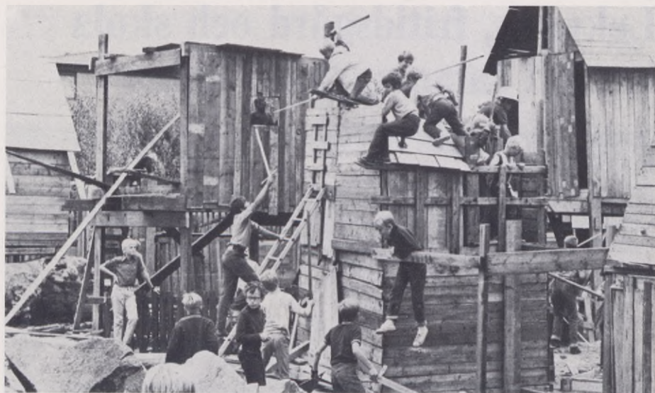
"Parken skall inte vara något färdigt och slutgiltigt." — I de största lekparkerna har storstadsbarnen fått samma chans att bygga lekstugor som barnen på landet alltid haft.

behov av att påverka sin fritidsmiljö. Parken skall inte vara något färdigt och slutgiltigt utan den skall hela tiden förändras. Det är de som utnyttjar parken som skall förändra den. Och denna förändring ser jag som den kanske viktigaste aktiviteten i en fungerande park.