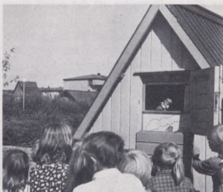
Tuffa grabbar har ofta god hand med djuren. — Parkleksledarna går in för att få med barnen i kreativa aktiviteter såsom dockteater.

öppna mellan 9—17, men just för att bättre tillgodose de lite äldre ungdomarnas behov har vi börjat fundera över om vi inte i stället borde ha öppet mellan 12—20. Lekparkerna Flatås, Backa Västergård och Svartedalen har i regel öppet till 20 eller senare och det har slagit mycket väl ut.