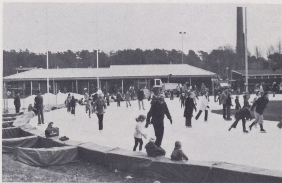
Ruddalens idrottsplats, som ligger i ett fint naturområde i västra staden, lockar ett mycket stort antal sportutövare och därmed har också bevisats att en sådan anläggning inte nödvändigt behöver ligga i centrum.

för göteborgaren med de resurser som den nya förvaltningen sammanlagt har. Och jag är övertygad om att det skall gå om vi alla är tillräckligt ödmjuka inför den svåra samordningen och ser som sin uppgift att samverka för dem vi är satta att betjäna under deras fritid. Då kan olyckskorparna komma på skam. Vi kanske själva tidigare har stämt in i korpalåten någon gång och medverkat till åsikten att allt skulle gå snett. Tänk om Göteborg skulle lyckas med sitt samordningsgrepp av fritiden. Då skulle alla som är med i ett intressant samordningsjobb få den trivsammaste och bästa starten in i en ny förvaltning. Vi kanske i själva verket är mer lika varandra i våra strävanden än vad vi trott.