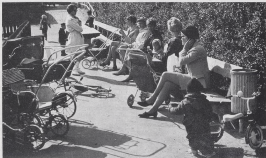
"Parken kan tillgodose en del av gemenskapsbehovet i svenska städer." — De allra yngsta barnen och deras mammor eller skötare har fått en lugn solig del av lekparken.

En annan viktig roll för parken måste vara att ge utlopp för ungdomarnas