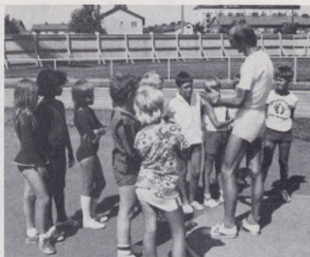
I Idrottsskolan, som startar när vanliga skolan slutat, får de unga eleverna lära sig idrotta på ett "åldersriktigt" sätt.

Att närmare ingå på de skilda avdelningarnas uppgifter synes ej erforderligt, då uppgifterna i stort framgår av avdelningarnas namn.