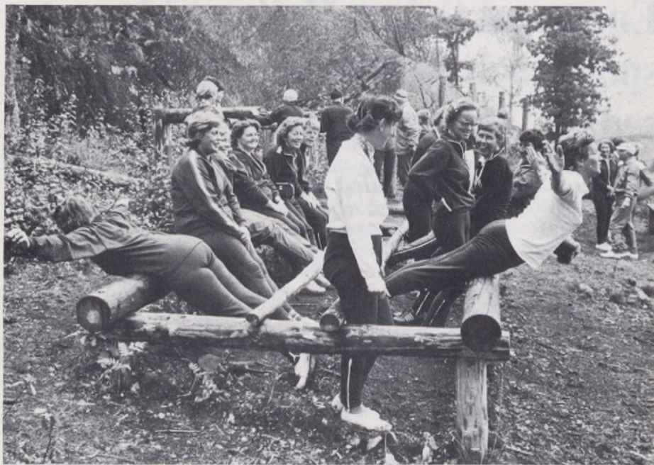
Idrotts- och friluftsförvaltningen är medarrangör i Motionsleken — ett motionsprogram för alla med aktiviteter hela året. Bilden är från Skatås, där erfarna ledare två gånger i veckan svarar för "gå-lunka-löp i naturen".

Samhet är uppbyggd som en levande aktivitet under göteborgarnas fritid, dagar och kvällar, vardagar och söndagar, under helger och under alla årstider och i alla slag av väder.