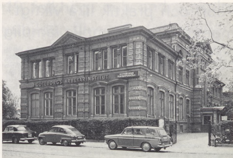
Göteborgs folkhögskola i en folkbildningens "högskola" — Göteborgs Arbetarinstituts ärevärdiga byggnad vid Magasinsgatan

tar man en liknande utbildning på ett universitet. Andra tänkbara institutioner, att ägna sig åt sådan här utbildning, är bl. a. lärarhögskolor och socialhögskolor.