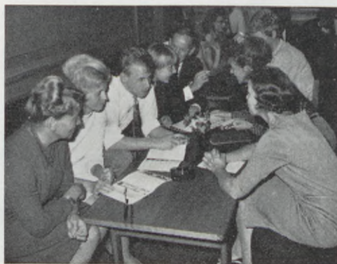
Aktivitet redan från början vid "isbrytar-momentet" i kursstarten.