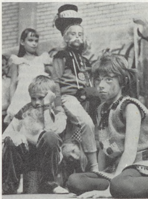
Skolteater, Ryaskolan, Göteborg.

Nu kan man för all del säga att grundskolans läroplan i detta avseende är en skrivbordsprodukt och att dess anvisningar långt ifrån kunnat omvandlas till praktisk verklighet. Detta av många anledningar som jag skall återkomma till. Men det är första gången på decennier som vi åter-