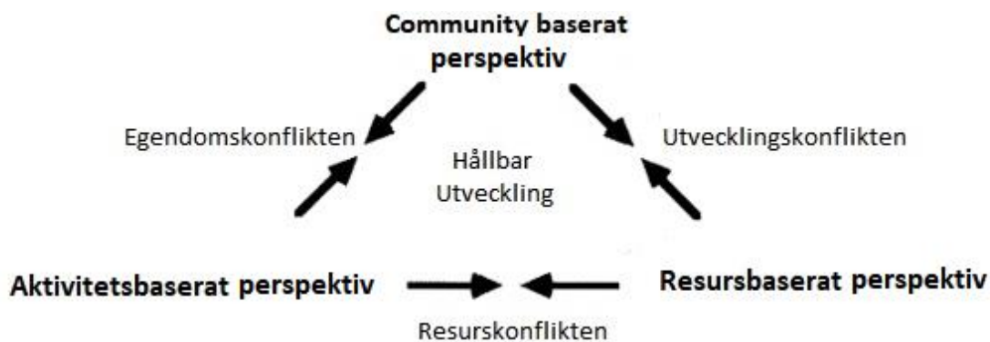
Figur 2. Intressekonflikter mellan hållbarhetsperspektiv inom turism. Modell baserad på Campbell (1996) och Saarinen (2006).

värderas olika av olika intressenter vilket i denna uppsats tolkats utifrån Saarinen (2006) motstridiga hållbarhetsperspektiv. Selman (2012) menar att landskapstjänster som saknar ett kommersiellt värde ofta nedvärderas med risk att dessa tjänster blir åsidosatta och missbrukade till förmån för andra tjänster med kommersiellt värde. Utifrån Nordiska Ministerrådets (2018) rapport gällande en omvandling av naturskyddade områden, till att även börja inkludera kommersiella syften, går det att dra en parallell till att det är dessa tendenser som skapar de drivkrafter som i detta fall önskar att se en omvandling av strandskyddat område för att gynna ett kommersiellt friluftsliv/naturturism. Dessa tendenser beskrevs i föregående avsnitt utifrån intressenternas olika antaganden om vad definieras som hållbart. Kopplas Saarinen (2006) hållbarhetsperspektiv till Campbells (1996) modell över intressekonflikter kan intressekonflikterna inom kontexten för turism tolkas enligt följande modell: