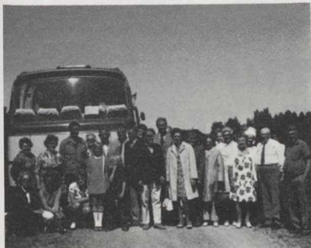
Det här är Kalmarbor i full frihet någonstans på en väg på Öland. Redaktören vet inte var, så skriv inte till honom.

de på ett berömligt sätt skötte till allas fulla belåtenhet. Träffen var förlagd till Pensionat Paradiset i Borgholm. Efter samling avåts kl. 12.30 middag med ett mycket rikhaltigt och gott smörgåsbord samt varmrätt. Sedan blev det dans för alla dem som ville ta sig en svängom. En del föredrog att ta sig en titt på den lilla idylliska Ölandsstaden och inhandla ett litet minne i någon av dom små souvernirbutikerna eller besöka glasbruket och där göra ett eller annat fynd i glas. Kl. 16.30 serverades kaffe med dopp och däremellan bjöd källarmästaren på färsk frukt. Vädrets makter var gynnsamma med sol och värme. En mycket stor anslutning kunde noteras. Över 200 medlemmar hade mött upp. Om det var bron som lockade eller den alltid trevliga anda som jämt råder på dessa träffar är svårt att säga. Kalmarföreningen får genom Status tacka Ölandsföreningen för en i allo lyckad kamratträff och i detta tack tror vi att samtliga lokalföreningar i länet instämmer.