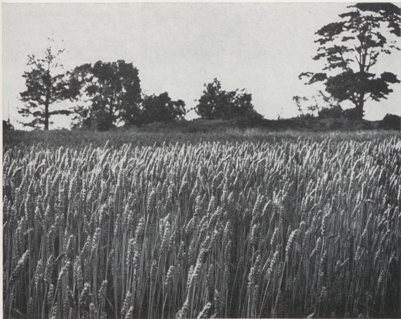
Säden står tät och oböjd men är den när den väl har förvandlats till bröd ofarlig för människan?

tunga metaller. Oljan är kanske av de allra farligaste luft- och vattenföroreningarna i vår tid. Den andra åtgärden är sekundär: Rening av röken från alla förbränningsanläggningar och den tredje åtgärden är på lång sikt nödvändig, nämligen installering av elektrisk uppvärmning och nya aggregat för återvinning av energi.