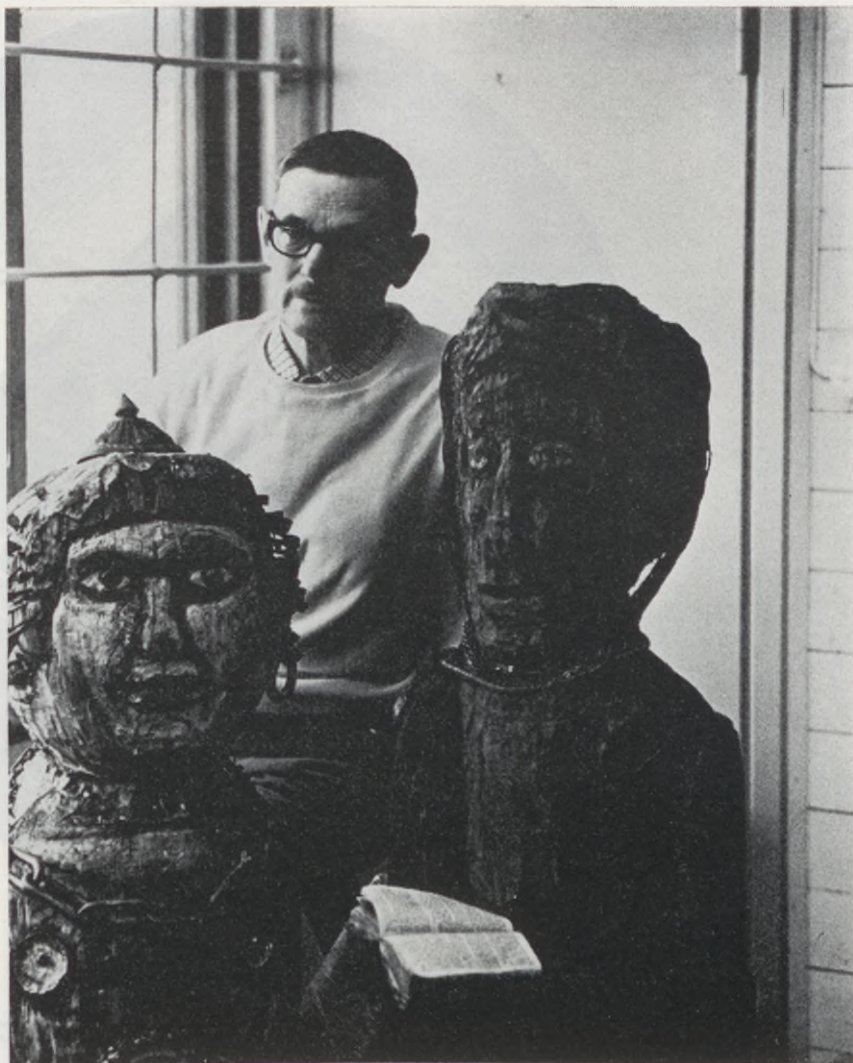
I konstens värld finns inga "döda ting" — bara människor som inte upptäckt livet.

I min situation finns det ingenting att göra; det vill säga "allt jag gör är i själva verket likvärdigt, och alltsammans förblir joller för mig själv" inför dödsdomen. Vad det ytterst gäller, skriver Sand, är att kontrollera