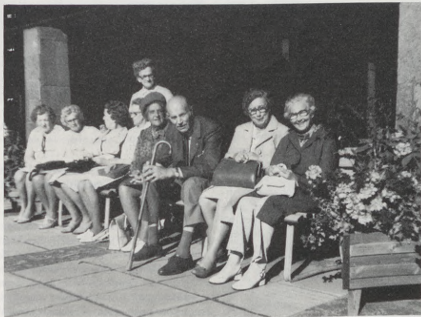
Glada göteborgare tar igen sig i Skövde.

Som avslutning på sommaren eller inledning på hösten brukar Hjärt- och Lungsjukas Konvalescentförening i Göteborg anordna en busstur sista lördagen i augusti. Så även i år. Resor har gått i öst och väst, norr och söder. Det blir svårt att finna nya resmål. Vi får börja om från början. På så sätt kan de medlemmar som varit med förut få återse trevliga platser, minnas och jämföra då och nu. För många kanske det är första gången och det är ju lika roligt.