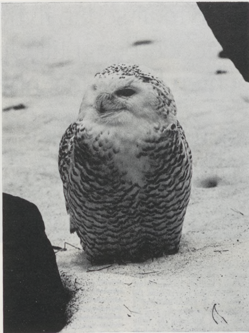
Den som är vis röker icke.

Att utfärda regler mot rökning är dock bara ett knep, liksom varje sorts regel-stiftande som väcker min anarkistiska känslighet. Jag tror jag skulle föredra att offentlig rökning blev lika tabu som att urinera öppet (och jag syftar inte på nakenheten utan på lukten och hälsoaspekterna). Inom parentes sagt är det intressant att ett av de få ställen där icke-rökning är genomförd är i skollokaler. Jag var vikarierande lärare i Westwood High School flera gånger, och kunde inte ens gå in i lärarnas rum, så rökfyllt var det. Rökning är förbjuden i sko-