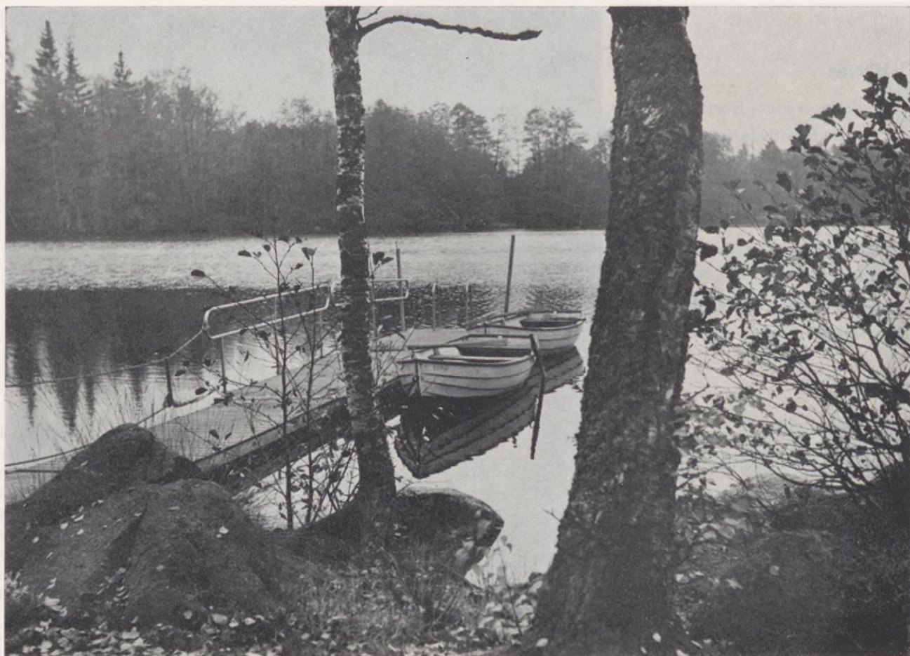
En bild av den vackra Svanshallssjön.

bar dialog med myndigheterna" yttrade Bertil Göransson — och fortsatte. "Jag vill se att andra följer efter och slutar att vänligt räcka fram handen och ta emot vad som erbjudes. Svansholmen kan också tänkas bilda mönster för ett nytt tänkande inom sjukvården. Vi ser här att idealiteten ingalunda är överspelas. Den är fortfarande en positiv kraft som samhället måste ta till vara, i all synnerhet som vi är tvingade att sätta in alla tänkbara åtgärder för att bryta trenden till ökade sjukvårdskostnader".