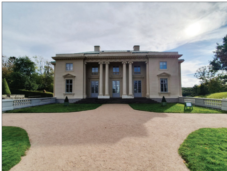
Bild 1: Borgerlig sommarvilla från slutet av 1700-talet, Gunnebo utanför Göteborg. Foto: Susanna Rolfsdotter Eliasson, 2020.

adelsmän och militärer på malmerna i Stockholm (ibid). Malmgårdarna hade sin motsvarighet i Göteborg i 1700-talets landerier. De hade dubbla funktioner för sina högborgerliga ägare, då de fungerade både som jordbruk för att bidra till hushållet i staden med mat och tjänade som familjernas sommarställen under de varma månaderna (Andreassen & Görling Cardevik 2012:33).