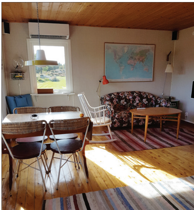
Bild 19: Vardagsrummet hos Ebba och Kalle i Bohuslän, första sommaren. Foto: Susanna Rolfsdotter Eliasson, 2017.

På något plan kan intervjupersonerna och deras föräldrar med andra ord sägas vara överens om värdet av återbruk, men det blir tydligt att det råder delade meningar mellan dem när det gäller vad som är åtråvärt bland tillgängliga begagnade föremål. Kalle beskriver hur detta kan resultera i missförstånd.