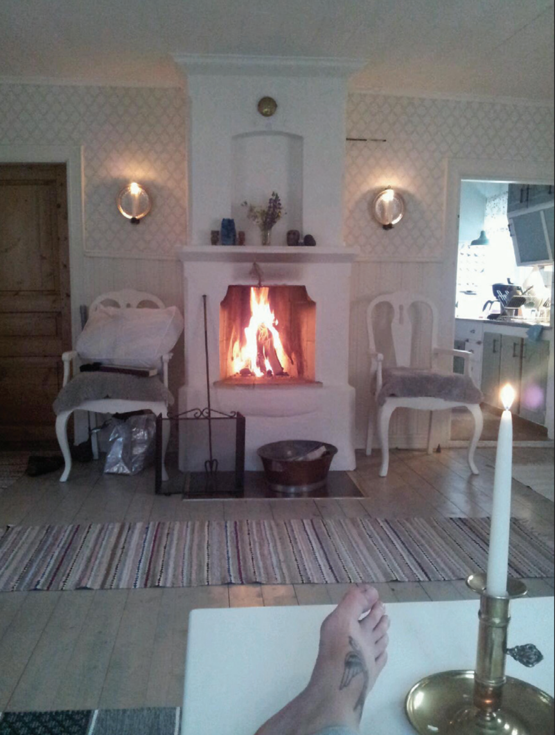
Bild 9: Framför brasan på torpet. Foto: Susanna Rolfsdotter Eliasson, 2014.