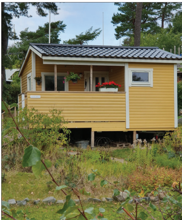
Bild 4: Tidstypisk, välvårdad, liten sommarstuga från mellankrigstiden i stugområde utanför Göteborg.

platta, på vedspis eller med hjälp av fotogen- eller spritkök och personlig hygien upprätthölls genom tvätt i handfat eller genom bad i närliggande sjö (Phil Atmer 1998:369).