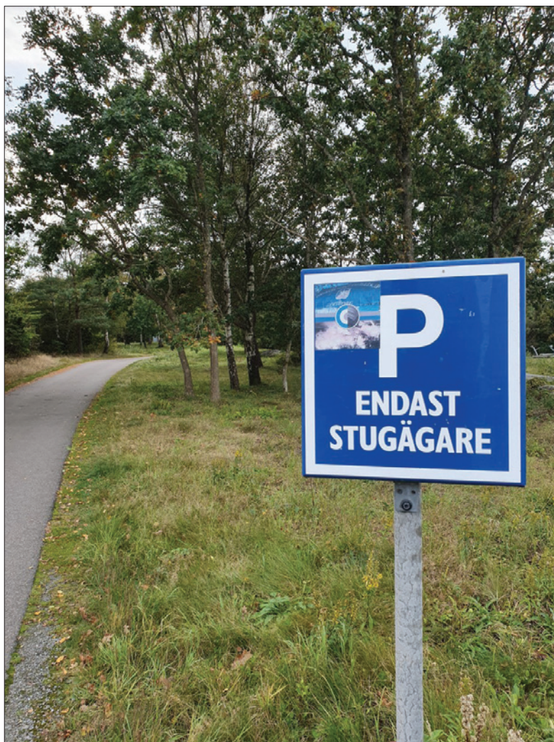
Bild 34: Parkering, endast för stugägare.