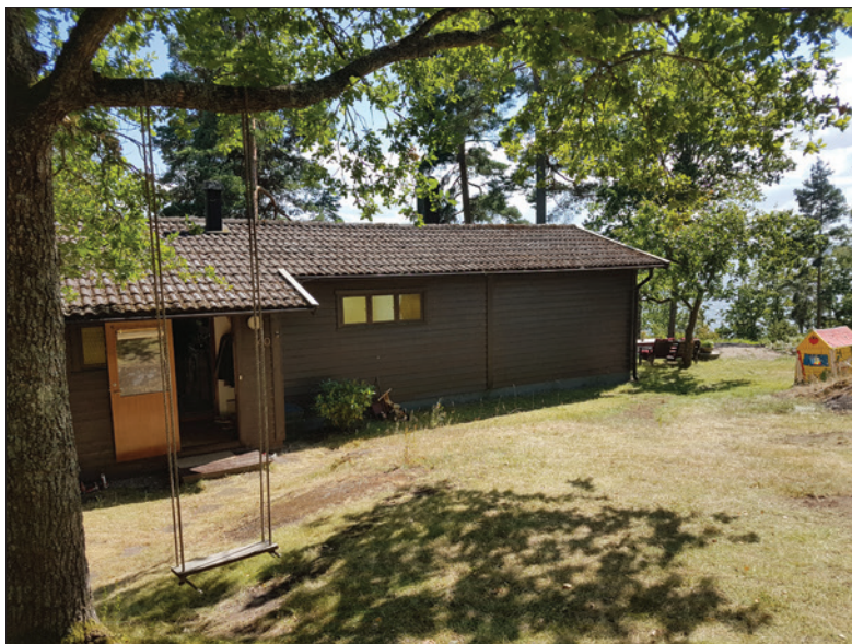
Bild 33: Johannas och Kristoffers stuga från entrésidan.

detta innebär bestäms med andra ord utifrån ideal kring vad som utgör ett gott, men även ett medvetet och reflexivt medelklassliv i det senmoderna Sverige.