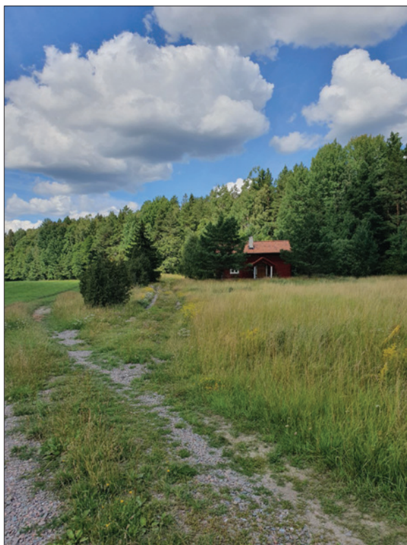
Bild 3: Enskilt läge. Torp i Södermanland. Foto: Susanna Rolfsdotter Eliasson, 2020.

Sommarstugan kan även förstås som en del i folkhemskonceptet och idealen var att bygga ny stuga och inreda med nya inventarier (Gunnemark 2016:19,188). I enlighet med tidens ideal, där fritidsboende skulle vara tillgängligt för alla, var tanken att bygga enkelt och ekonomiskt. Samtidigt skulle hus och inredning utformas efter funktionalistiska principer med tydligt avståndstagande från den utsmyckning som karaktäriserat tidigare ideal (Tell 2002:42). Även när det kom till livsföring i fritidsbostaden var enkelhet ett ideal och en eftersträvarsvärd kontrast till stadslivet. Trots att standarden i staden vid mitten av 1900-talet inte var särskilt hög, kunde de familjer som var sommarboende på landet vid tiden uppleva en märkbar skillnad (Gunnemark 2016:189). En del av de stugor som byggdes före 1960 var mycket små och kunde mäta mellan 12–16 kvadratmeter, med ett rum och penry (ibid:190, Tell 2002:40). Matlagning utfördes där med hjälp av elektrisk