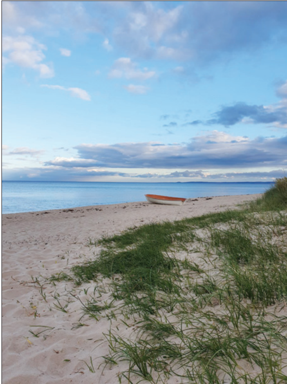
Bild 2: Kustlandskap i nordöstra Skåne. Foto: Susanna Rolfsdotter Eliasson, 2020.

utveckling på Östkusten och i Sydsverige (ibid:26, 256). Turismhistorikern Wiebke Kolbe (2018) föreslår havsbaden som liminoida rum. Där blev möjligt att överskrida vardagslivets gränser, både i förhållande till kroppen och till det sociala livet i övrigt och de strikta regler som gällde där (ibid:47ff). Även havsbadandet var dock något att ägna sig åt främst för hälsans skull och läkare uppmanade till detta friska och välgörande nöje. Badorter växte också upp kring enstaka publika inrättningar såsom gästgivargårdar, ångbåtsstationer eller primitiva varmbadhus. De kunde även byggas nya från grunden med logimöjligheter i anslutning, genom privata investeringar (Krantz 1962, Stackell 1974). ”Badgästernas liv under säsongerna på dessa mindre badorter var, som även dessas yttre gestalter, enkelt och föga ceremoniellt” (Stackell 1974:203).