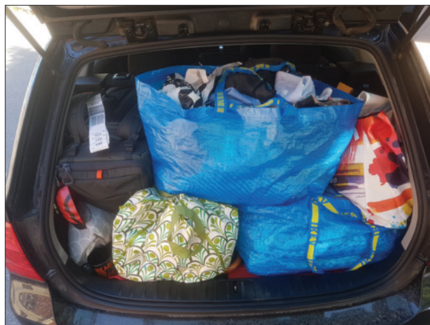
Bild 26: Bagageutrymmet innan avfärd mot Skåne.

Packningen stod redo i lägenheten tre trappor upp när jag kom. Jag fotograferade väskor, kassar och påsar medan jag väntade. Jag undrade hur vi skulle få plats med allt i bilen? Gabriella hade skrivit en lista inför avresan på saker som behövde klaras av innan hon åkte. Bettskenan och solkrämen var nedpackade och redan överstrukna punkter på listan. Tömma soporna är en viktig punkt, ingen vill komma tillbaka efter fyra veckor i fritidshuset och inse att soporna är kvar i hinken under köksbänken. Grannen har lovat vattna blommorna. Vi har sprungit upp och ned för trapporna i hyreshuset med packning. Bilens bagageutrymme fylldes snabbt. Den stora resväskan, ryggsäcken och de blå bärkassarna från Ikea trängs med tygpåsar, plastpåsar och papperskassar av olika slag. De flesta väskor är stängda och deras innehåll är dolt för mig. En påse är till brädden fylld med skor. I övrigt kan jag se kläder, som jag antar är till hela familjen, i den öppna kassen. En blå Hortensia som fått löfte om att komma i jorden vid ankomst till fritidshuset fick åka i baksätet. När pusslet var färdigt tog jag en bild av det välfyllda bagageutrymmet.