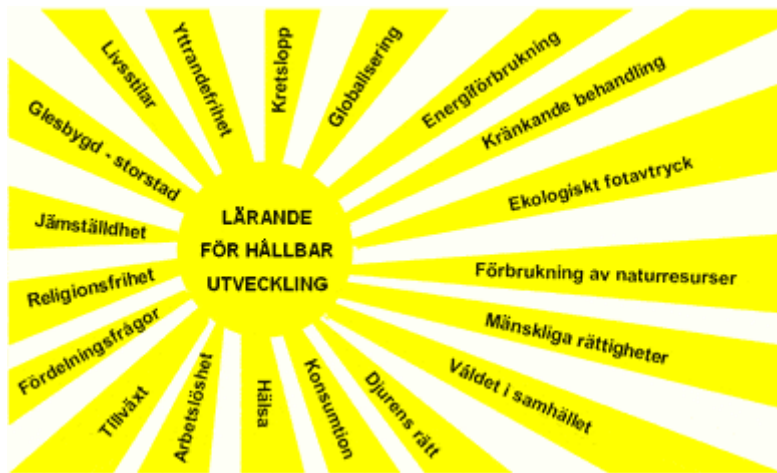
Fig. 2 Solen och dess strålar representerar utbildning för hållbar utveckling (Myndigheten för skolutveckling, 2005c)