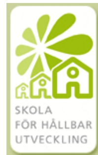
Fig. 6 Logotyp för utmärkelsen "Skola för hållbar utveckling" (Myndigheten för skolutveckling, 2005e)

Denna utmärkelse grundades 1998, med namnet "Utmärkelsen Miljöskolan", efter ett förslag att införa miljömärkning av skolor (Skolverket, 2002). Kriterierna formades efter det som står om värdegrunden i läroplanen "...främja aktning för varje människas egenvärde och respekt för vår gemensamma miljö" (s.108). Namnet är numera ändrat till "Skola för hållbar utveckling" för att bredda innehållet så att det fokuserar mer på frågor om hållbar utveckling i samhället (Myndigheten för skolutveckling, 2005e). Syftet är att ge det pedagogiska arbetet ett tydligt fokus genom läroplanens mål samt att ge möjligheter att arbeta ämnesövergripande (Myndigheten för skolutveckling, 2005g). Utmärkelsearbetet skall utgå från varje skolas egna förutsättningar och kopplas till de projekt som redan är igång i skolan men genom utmärkelsearbetet kan man få en skjuts framåt. Det är viktigt att arbetsbelastningen inte blir större, utan att man ser de uppsatta kriterierna som ett redskap att välja innehåll eller som en riktninggivare för hur arbetet skall utföras.