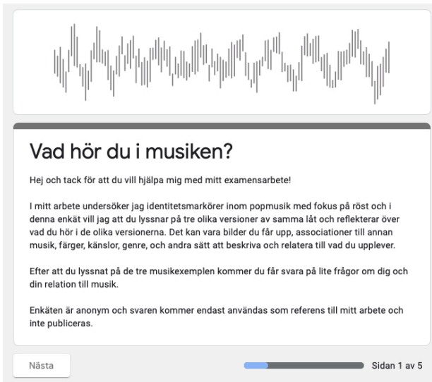
Figur 1. Enkät sida 1, beskrivning av enkät.