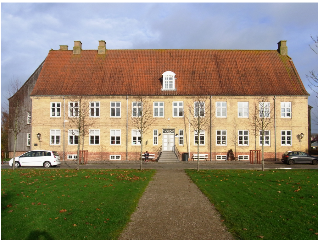
Foto från 2018, närbild av systrahuset.