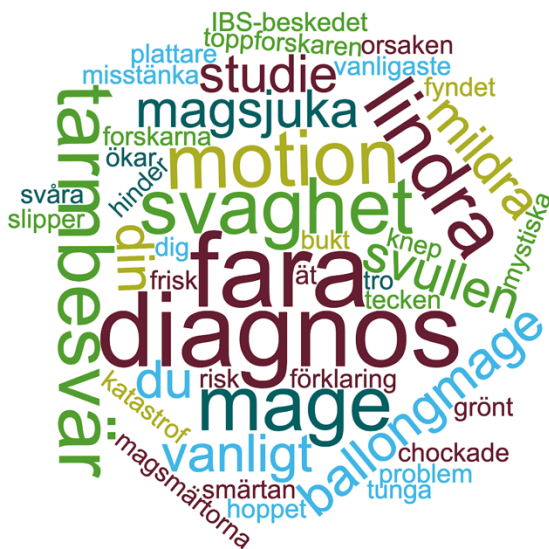
Figur 2. Ordmoln

Nedan är en illustration av de vanligaste värdeladdade orden som är skapade i ett fristående onlineverktyg för att göra ett så kallat ordmoln. Ju mer frekvent återkommande ett ord är, desto större blir det i illustrationen. Se figur 2. Värdeladdade ord kan ge en positiv eller negativ association.