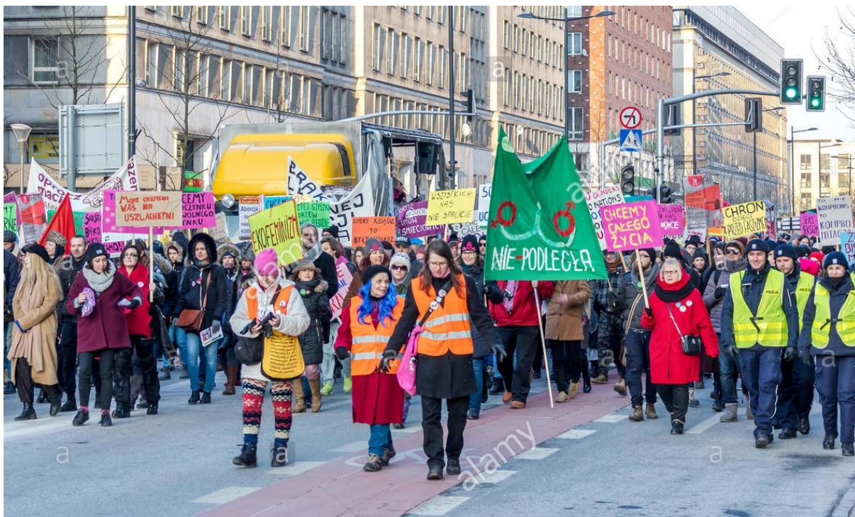
(Figur 3: Warszawa, 04.03.2018, XIX Manifa,)