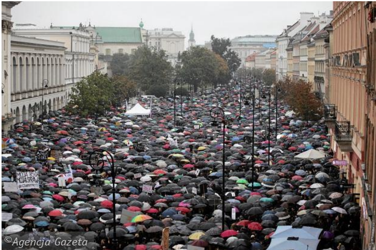
(Figur 2: Warszawa, 03.10.2016, Czarny Protest,)