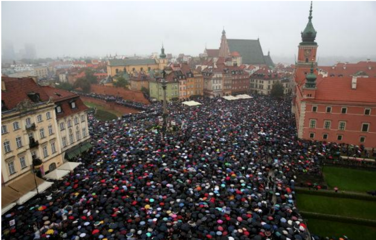
(Figur 1: Warszawa, 03.10.2016, Czarny Protest,)

försvårades genom att både läkare och farmaceuter kan använda sig av s.k. samvetsklausul. Det innebär rätten till att avvisa en patient som vill ha tillgång till preventivmedel, utföra abort (inom de redan extremt begränsade ramarna) eller genomföra in vitro-fertilisering som inte är i enlighet med läkarens/ farmaceutens religiösa övertygelse. Inrättande av ett nytt centraliserat institut som ska fördela ekonomiskt stöd till NGOs 21 ledde till oro hos många LGBTQ och feministiska organisationer som fruktar att den konservativa regeringen kommer strypa deras ekonomiska stöd.