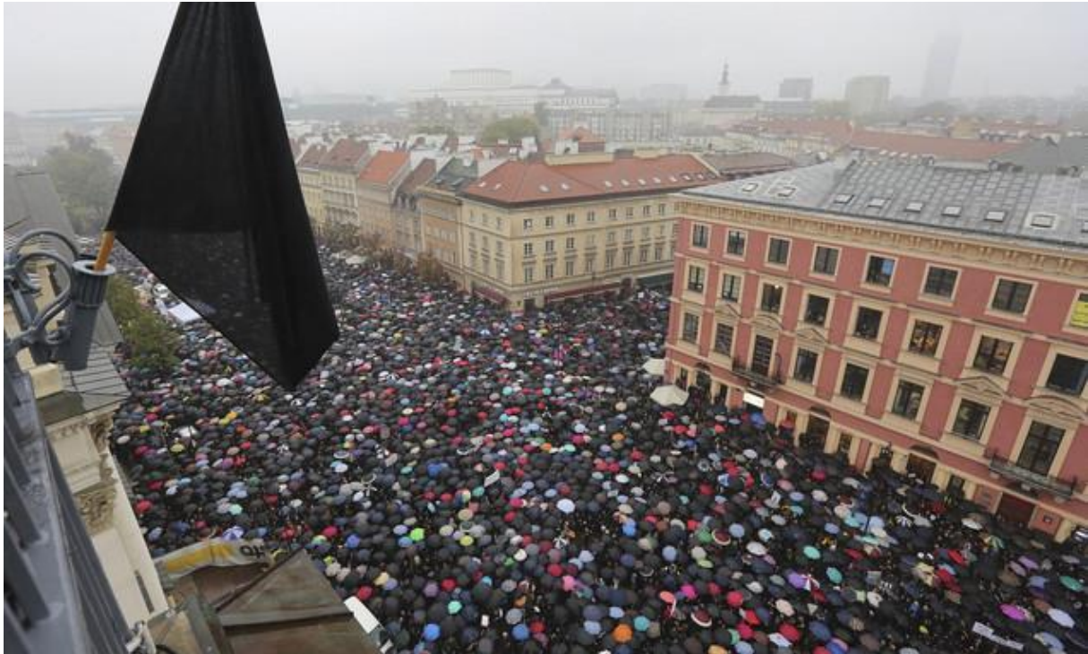
(Figur 5: Warszawa, oktober 2016, Zamkowy- torget, folkmassan på Czarny Protest, bild: AP Photo/Czarek Sokołowski)

lyckats få ett brett samhälleligt stöd. Så varför kände de tusentals kvinnor (och män) att de nu måste visa sitt nyvunna politiska engagemang på städernas gator och torg?