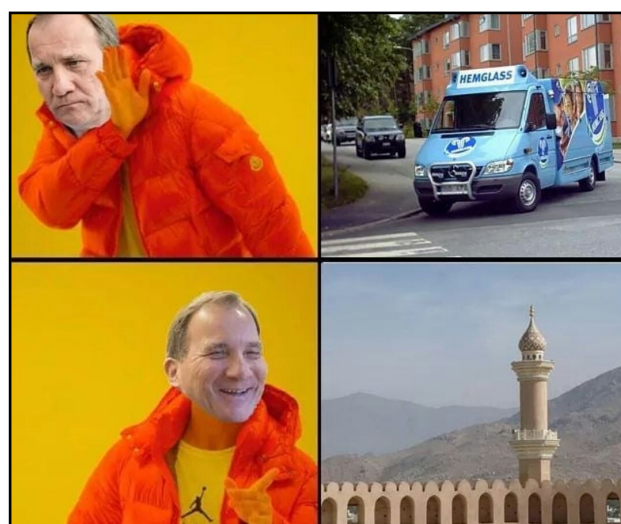
EX22 publicerad på AFS officiella Twitter-konto den 18 Maj 2018.