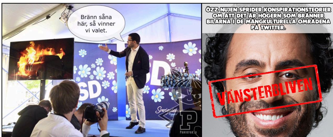
EX43 Publicerad på PAN den 14 augusti 2018. Kommentar "Sektledaren inför förra valet. Det funkade ju rätt bra den gången."

PAN erkänner här att den massmediala bilden till synes ger de högerextrema rätt, om att det är invandrare i förorten som till utfört bilbränderna, men försvarar sig genom att lyfta konspirationsteorin om att det egentligen är SD och AFS som ligger bakom dessa dåd. Rent retoriskt är situationen tacksam att tillskriva spekulationer och anekdotisk bevisföring eftersom de faktiska bevisen för vem som ligger bakom är svag. Utredningen har lett till några få gripanden. Dock har inget åtal väckts när detta skrivs (8 Januari 2019), vilket fortsatt ger möjligheten till en öppen ryktesbildning.