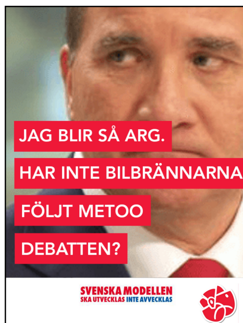
EX5 Publicerat på PIK den 14 augusti 2018.

PAN använder också hyckleri som en grund i sina argument under den undersökta perioden. Skillnaden är att fokuset är bredare och argumenten grundas mer i historiskt hyckleri, istället för hyckleri i närtid. Sedan kan samröre med SD i allmänhet användas som grunden i argument hos PANs mem.