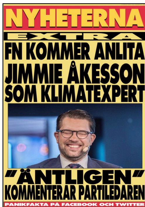
EX29 Publicerat på PAN den 13 augusti 2018