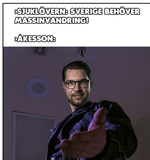
EX30 Publicerat på PIK den 6 september 2018.

den kvinnliga huvudrollen och säger "Come with me if you want to live" (kom med mig om du vill överleva). En trolig tolkning av memet, är att det spelar på parallellerna mellan filmens handling och invandringen till Sverige. Istället för att maskiner tar vår plats är det invandrare i PIKs mem. I memet är det Jimmie Åkesson som är hjälten som ska rädda Sverige från att gå under av invandring, istället för filmen hjältes som ska rädda mänskligheten från att utrotas av maskiner.