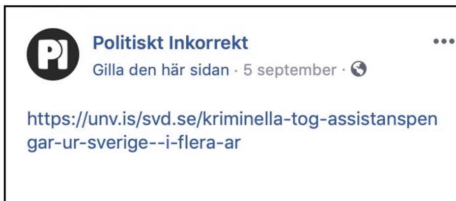
EX20 Exempel på användande av tjänsten unv.is