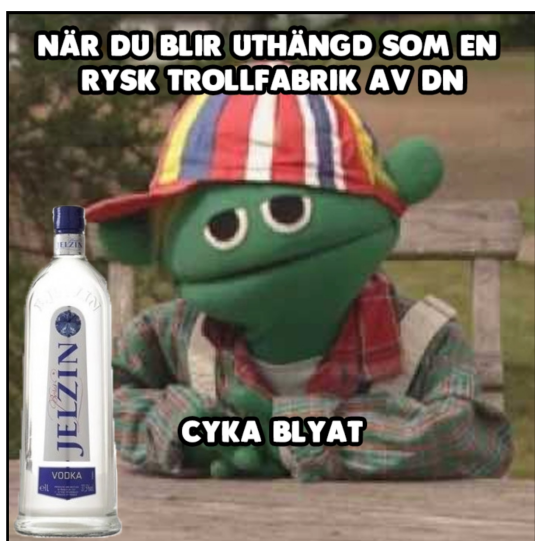
EX7 Publicerat på PIK 2 september 2018.

Det finns ett exempel på mem baserat på svensk populärkultur publicerat på PIK, det är ett inlägg med barnprogramskaraktären Skurt. I exemplet som fanns med i DN:s rapportering om högerextrema mem. Användandet har liknats vid alternativhögern i USAs användning av tecknade figuren "Pepe the frog" (Sköld et al., 2018). Förutom figuren har en flaska rysk vodka klippts in samt texten "cyka blyat" som är ryska fonetiskt stavat på engelska och betyder horbitch (whore bitch) eller jävla bitch (fucking bitch), enligt urban dictionary's topdefinitioner ( urbandictionary.com ,