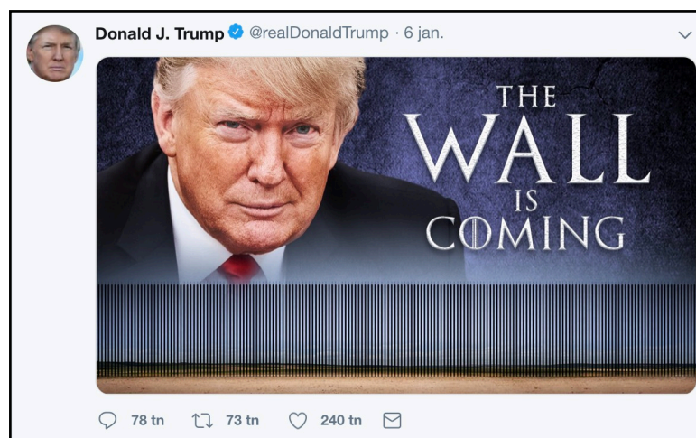
Mem publicerat av USAs President Donald Trump den 6 Januari 2019.

Forskningen på internet mem är bristfällig, något som kan förklaras av att mem först nyligen förhöjts från att ses som en smal subkultur inom internethumor, till något som är mer vanligt i digitala flöden. Samt ett på senaste tiden ökat användande av mem av högerextrema i sin kommunikation (Ewald & Lindkvist, 2018). Shifman pekar på 2008 års presidentval i USA, som punkten forskningen om fenomen som mem började tas på större allvar (2014: 119-122). Detta brukar ses som det första valet där sociala medier spelade en stor roll i den amerikanska politiken. Sådär sett från 2018 så kan dåvarande kandidat Obamas användande av Twitter ses som pittoreskt, jämfört med hur klimatet ändrats på plattformen och specifikt hur president Donald Trump använder det idag. I samband med valet där Donald Trump vann har högerextrema mem som "Pepe the frog" fått en central roll i hur det ses på politiska mem i en amerikansk kontext. "Pepe" är baserat på en amerikansk seriefigur som är en grön groda.