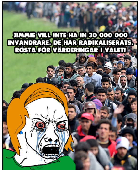
EX12 Memet i en amerikansk kontext till (vänster bild), mem publicerat på PIK den 7 september 2018 (höger bild).

PIK använder i EX12 ett direkt översatt mem, men utan att översätta till den svenska kontexten har de svårt att fungera retoriskt. Bristen kan vara att förståelsen fattas för vad bildens av gråtande liberaler har för innebörd i USA. För att mem ska bli globala menar Shifman att de behöver använda stereotyper som är igenkännbara i den lokala doxan (Shifman, 2014: 176). Att göra FG mer lik Annie Lööf kan ses som ett försök att översätta till en svensk kontext.