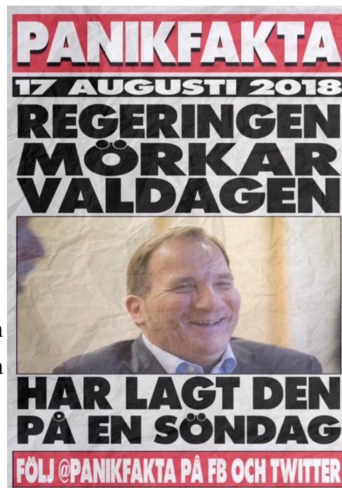
EX4 Publicerad på PAN den 17 augusti 2018.

När det gäller frusen rörelse så är det få foton som