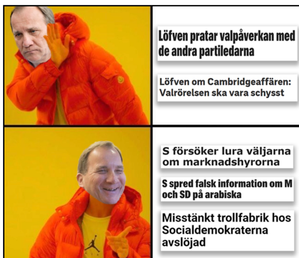
EX14 publicerad på PIK den 4 september 2018.