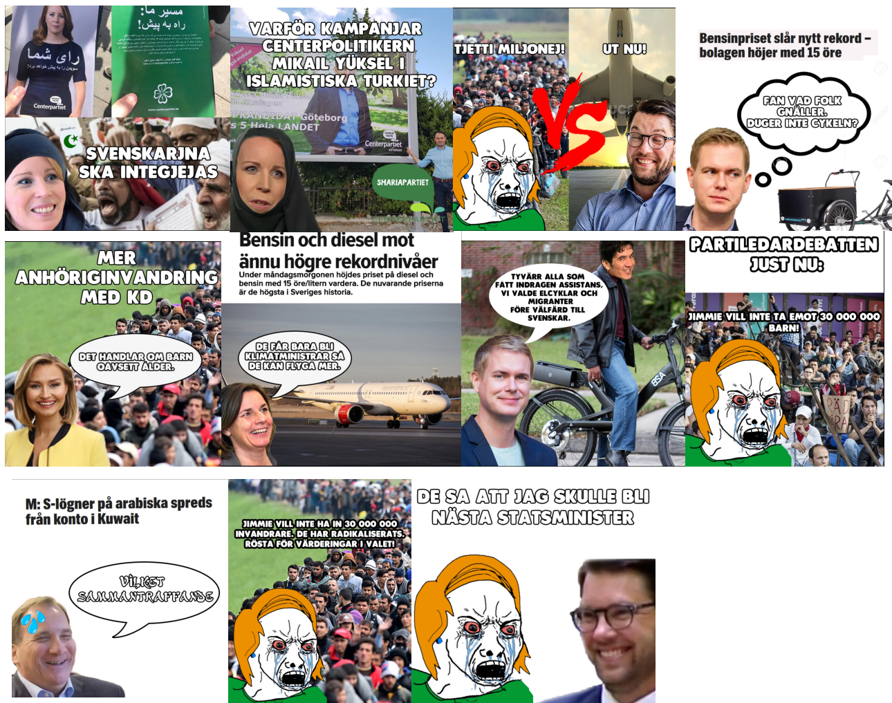
EX13 Kollage över mem som använder mode med politiska motståndare som reagerar på saker. Fem av dem är publicerade under de två sista veckorna av valrörelsen. Dessa är placerade i kronologisk ordning den första förekomsten är den 21 August och den sista är den 9 september 2018.

och Kristdemokraternas samröre med Sverigedemokraterna är anledning att inte rösta på M och KD.