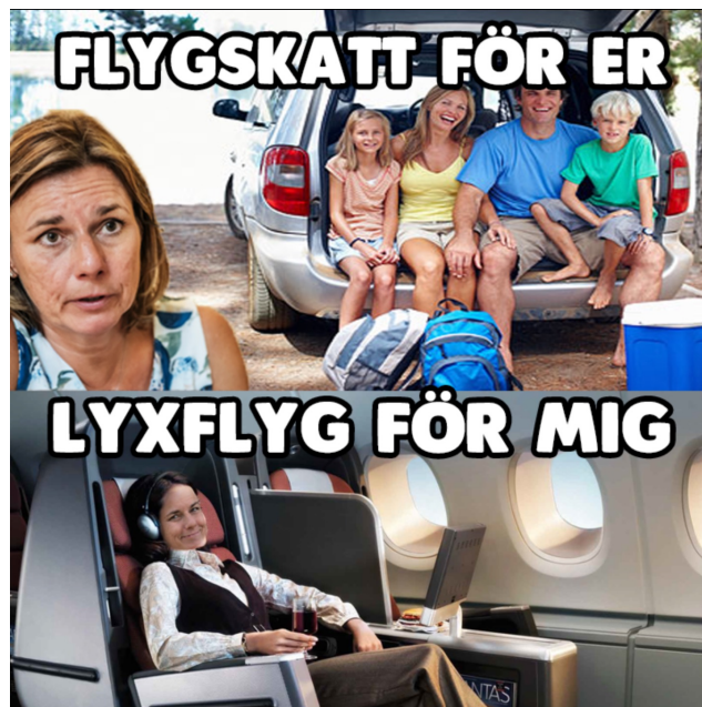
EX23 Publicerad på PIK den 24 augusti 2018.