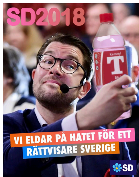
EX24 Publicerad på PAN den 8 september 2018.

använts av båda sidorna och på så sätt kunna byta betydelse helt. I EX43 och EX24 ser vi Jimmie Åkesson hålla tal, där element kunnat bytas ut för att ge en annan innebörd. Detta är det vanligaste sättet frusen rörelse används, genom att element som tv-skärmar, skyltar eller föremål någon håller i byts ut foton på politiker. I EX24 har en smartphone bytt ut mot en flaska T-sprit.