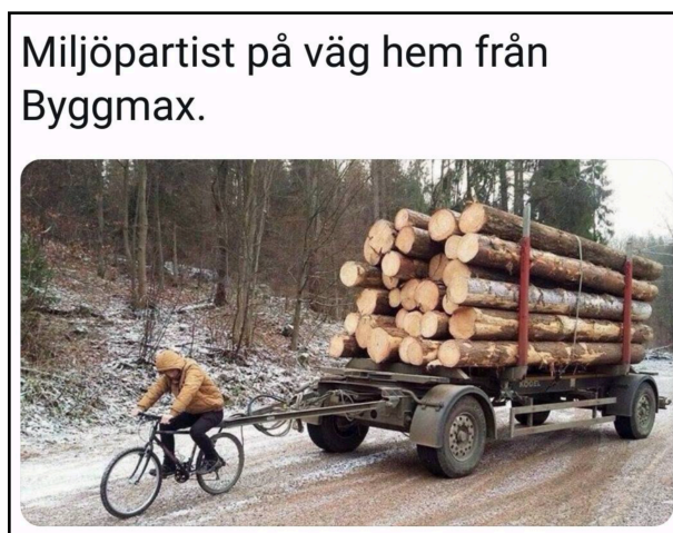
EX18 Publicerat av Vita Kränkta Kvinnor den 17 augusti 2018.