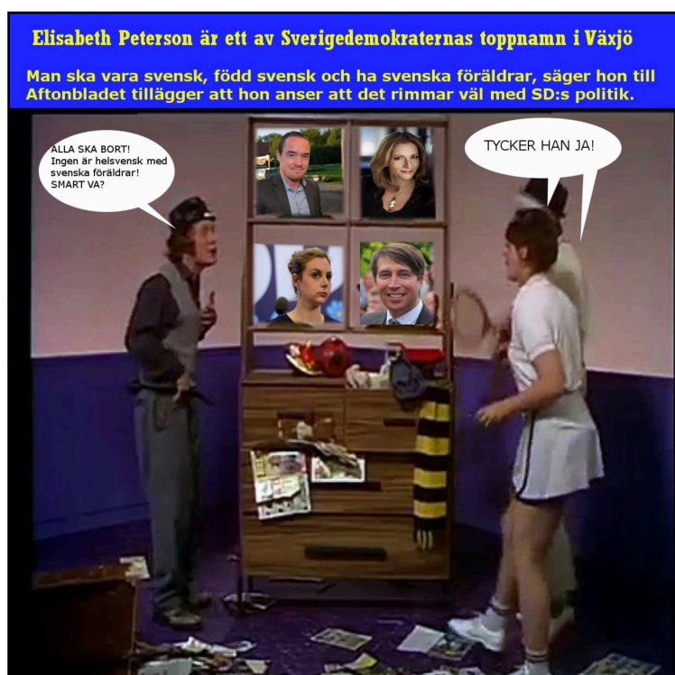
EX10 Publicerad den 19 augusti 2018 på PAN.

Från PAN är referenserna till populärkultur något mer utspridd men inte heller så vanlig med totalt sex mem. EX10 är det enda tillfället PAN använder svensk populärkultur, med ett mem baserat på ett segment från barnprogrammet "Fem myror är fler än fyra elefanter" (Sveriges Television, 1977). I segmentet som det är baserat på presenterar karaktären Brasse fyra alternativ varav ett ska bort, oftast slutar det med att de andra karaktärerna gissar fel och Brasse på ett självgott sätt presenterar det rätta svaret. Vilket får de andra att besviket säga till kameran "-Tycker han ja". I memet har de tre alternativen bytts mot sverigedemokratiska politiker och Katarina Janouch från partiet Medborglig Samling. De har just fått frågan om vilken av alternativen som inte är helsvensk med svenska föräldrar. De har gissat fel och Brasse förklarar att ingen av alternativen är helsvenska med svenska föräldrar, därför ska alla bort. Vilket bryter mot konceptet i programmet, men undviker att memet i sig lutar sig mot rasbiologi. Om en i memet setts som helsvensk, hade det betytt att memet i sig bekräftade rasbiologiska idéer, i att det skulle finnas en biologisk eller kulturell definition över vad som är en svensk.