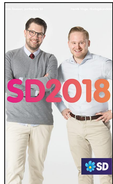
EX24 Till vänster är ett mem publicerat 18 augusti 2018 av PAN. I mitten är en valaffisch från Sverigedemokraternas kampanj 2014. Till höger är en valaffisch från 2018.