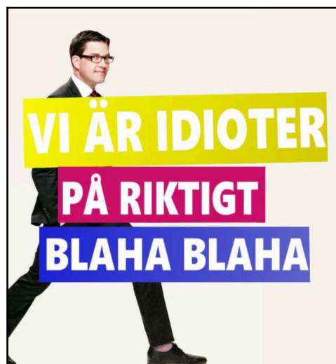
EX6 Publicerade den 26 augusti (vänster bild) och den 25 augusti 2018 på PAN(höger bild)