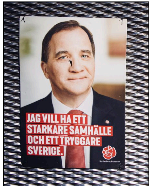
EX3 Till vänster är ett meme publicerat den 14 augusti 2018 vilket är dagen efter bilbränderna i Göteborg. Till höger är en affisch som förekommer i en bild av Erik Simander från TT. Denna affisch verkar inte använts under valrörelsen.