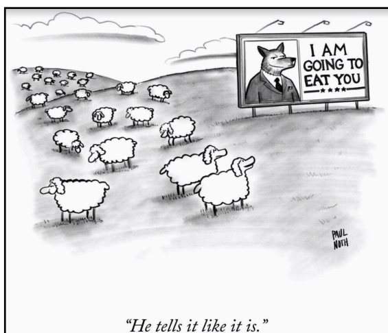
EX32 Publicerad på PAN den 4 augusti 2018

EX32 visar ett inlägg som endast är en delning av en satirteckning. Detta är något som båda sidorna gör. I detta fall är det PAN som använt en satirteckning från Paul Noth som jobbar på tidningen The New Yorker, som publicerade teckningen på valdagen den nionde november 2016 i USA (Spike, 2016). Både PAN och PIK använder sig av satirteckningar