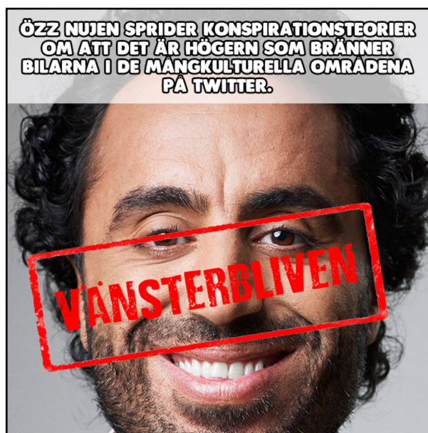
EX27 Publicerat på PIK den 15 augusti 2018.

negativa konnotationer även för någon som identifierar sig som höger, vilket gör att begreppet kan ha svårt att fungera retoriskt.