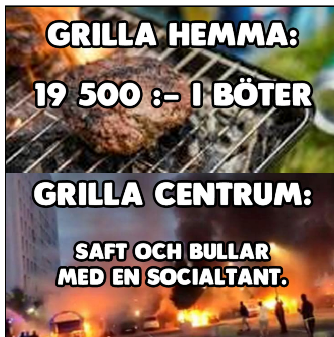
EX26 publicerat på PIK den 13 augusti 2018.

PAN kontrasterar på ett liknande sätt som PIK, något som är etablerat med SD mot i detta fall en manipulerad bild på Jimmie Åkesson som gravid. Medan Stefan Löfvens frilagda överkropp i PIKs inlägg klipps in med en enkel transparens mot bakgrunden av en eld, har PANs mem ett mer professionellt hantverk i hur Åkessons huvud på ett fotorealistiskt sätt klippts in på en gravid kropp. Medan Löfven liksom flyter i luften vill PANs mem ge intrycket av att Åkessons huvud är en del av den gravida kroppen.