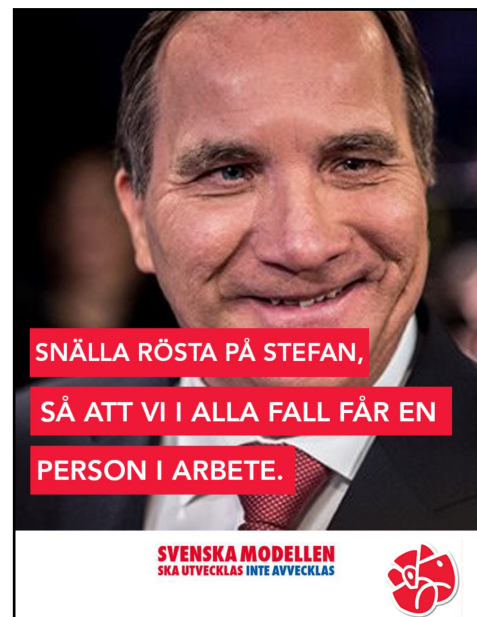
EX8 Publicerad på PIK 30 augusti 2018.