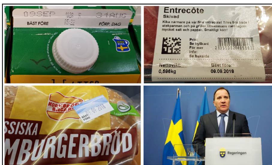
EX11 Publicerad den 5 september 2018 på PIK.

Memet lyfter inte upp varför Lövin förespråkar flygskatt och vilka vinster det har för miljön. Fokus är att håna och förminska hennes trovärdighet som politiker. Denna typ argumentation är vanligt mot speciellt MPs politiker. Liknande mem kan ses om förslaget om att beskatta parkeringar på storköp, poängen i memen är att MPs politik inte är förankrad i verkligheten. Argumentet får ett starkare logos eftersom den verklighet som skildras begränsas till de fall då detta är orimligt. Att det är orimligt att Lövin bara för nöjes skull åker lyxflyg och att byta ut bilen rakt mot en cykel när det ska storhandlas, kan när de isoleras från en större kontext enkelt utmålas som absurda.