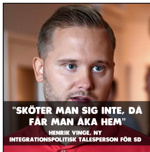
EX19 Publicerad på PIK den 16 augusti 2018. "Äntligen ett integrationsprojekt jag kan ställa mig bakom (Leendesmile)"

Här följer ett exempel på vad som väljs bort kontra vad som inkluderas. I EX19 ser vi en foto på Henrik Vinge från Sverigedemokraterna. Detta är ett exempel på det som inte klassats som mem på de undersökta sidorna. Detta är ett neutralt nyhetsfoto med ett citat från personen. Även om citatet kan väljas för att vinkla till avsändarens fördel, så gallrades dessa bort eftersom den memetiska och retoriska kvalitén är låg. Bilden fungerar endast som ett visuellt komplement till en till största delen objektivt återgivet citat. Självklart kan dessa typer av inlägg också övertyga, men det är nästan helt baserat