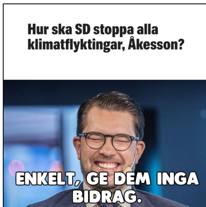
EX28 Publicerat på PIK den 13 augusti 2018.

Detta kan göra att PIK tvingas lägga mer av deras budskap i det latent, även om den satiriska tonen kan ge dem mer utrymme, i motsats till om de uttalat hade varit en nyhetssida. PIKs retoriska situation är som helhet oavsett friare än i SD-annonsen som analyseras av Mral, där det är en officiell trycksak från ett politiskt parti (2016: 109-110). PIKs koppling till SD har rapporterats av Dagens Nyheter (Ewald & Lindkvist, 2018), men kan oavsett inte ses som lika tydlig. På gott och ont så är båda sidornas avsändare anonyma. På gott för att de är svåra att avkräva ansvar om de sprider något som är osant, på ont att de har ett svagt etos i sin retorik. Shifman lyfter forskning som visar att intressegrupper och icke traditionella aktörer som producerade mem och virala kampanjer till valrörelsen 2008 i USA, var etablerade organisationer som hade finansiella och sociala resurser. De var inte någon ensam person med en kamera, som det kan se ut på ytan (Shifman, 2014: 144). Vilket även verkar stämna på PIK, medan det inte finns något som tyder på att PAN har stöd från någon större organisation som till exempel ett parti.