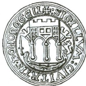
Sigillvm Civitatis Konongell