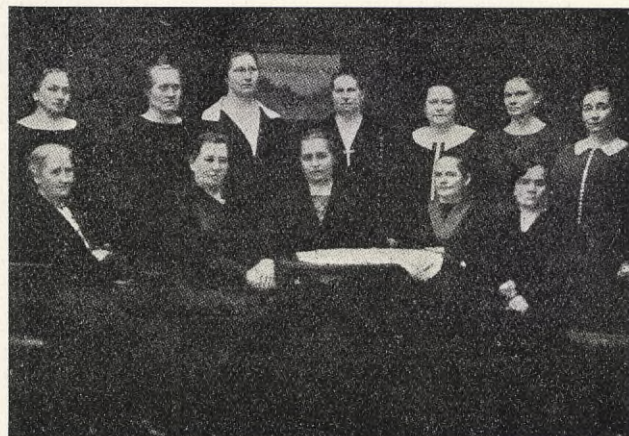
Den soc.-dem. kvinnogruppen i finska lantdagen.