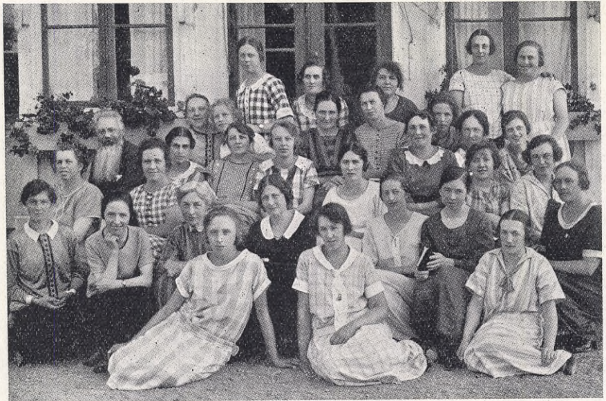
Deltagare i kvinnokursen i Fogelstad.