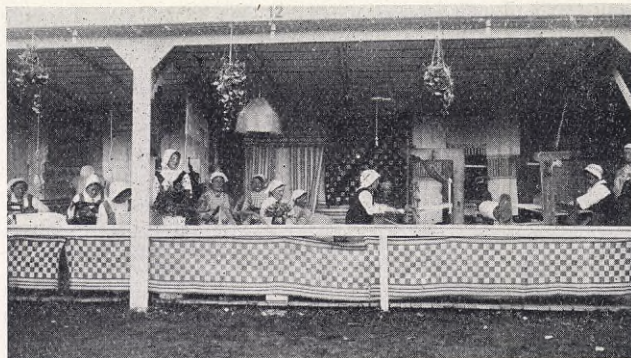
Vävkammaren på Hantverksmässan.