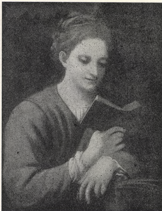
Målning av Corregio.

Arbetarekvinnor manifesteras eder fredsvilja och möt upp till Int. Soc. Kvinnodagens möten.