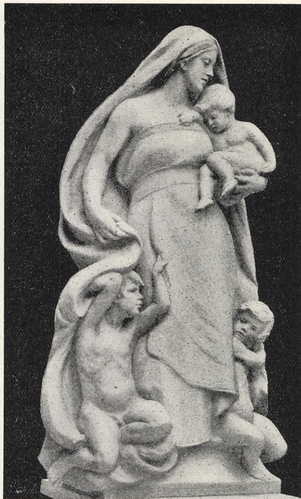
Skulptur av C. J. Allen.

Då vi i år följa parollen, må vi också göra det med känsla och övertygelse om vår samhörighet med arbetarklassens kvinnors strävanden i de olika länderna, för verklig och varaktig fred folken emellan och för socialismen.