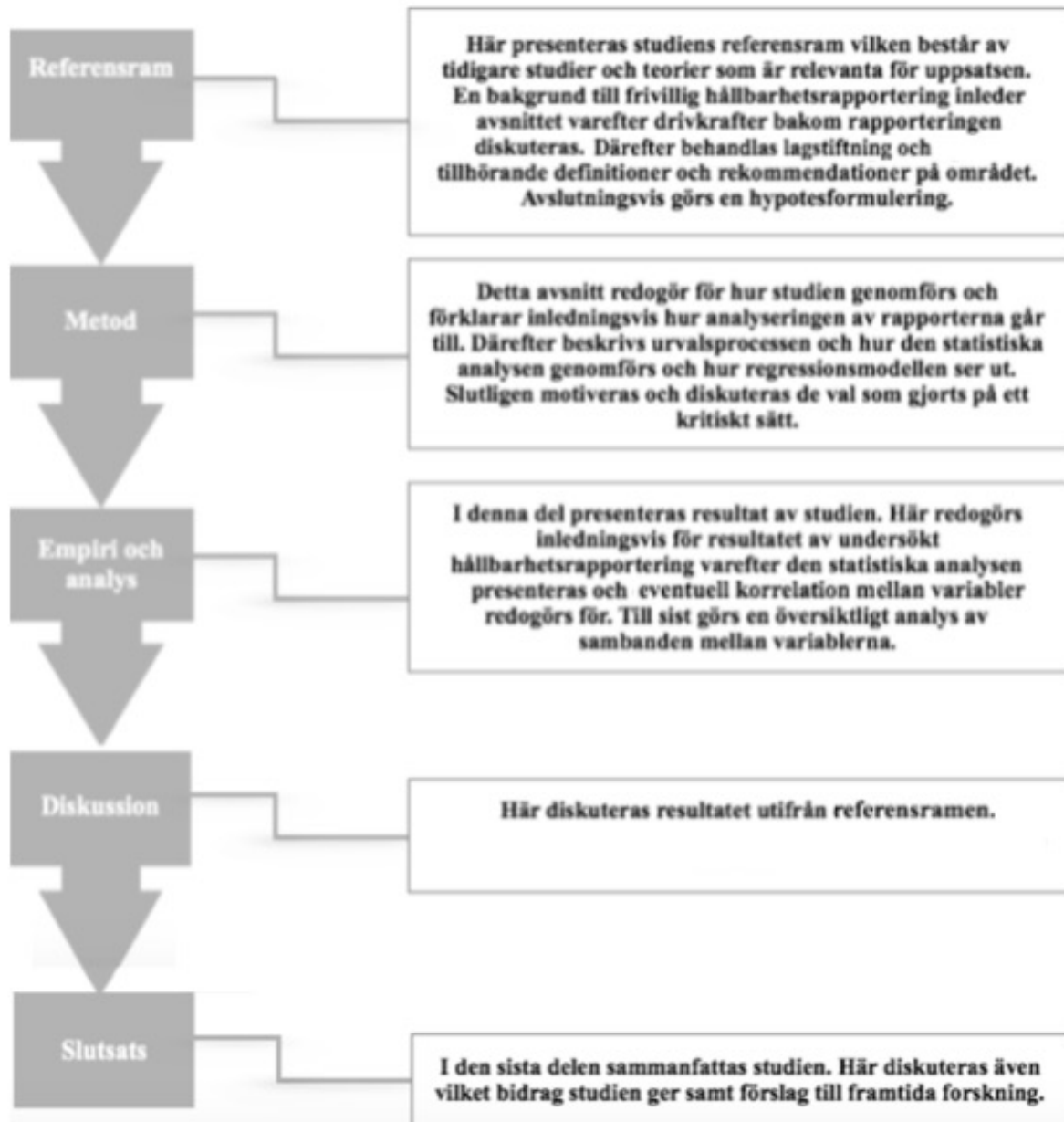
Figur 1. Studiens disposition