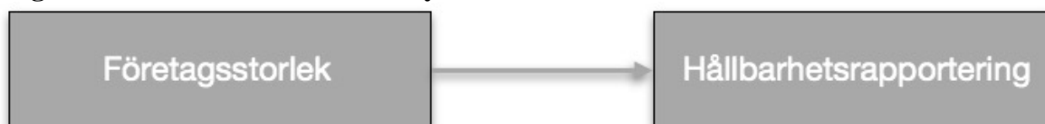
Figur 2. Sambandet som studien syftar till att undersöka

Frivillig hållbarhetsrapportering är ett område under snabb utveckling (KPMG 2017) och stora svenska börsbolag är erkänt duktiga på detta (Arvidsson 2017). EU-direktivet från 2014 har som syfte att öka transparens och jämförbarhet vad gäller information om hur företag arbetar med hållbarhetsfrågor (Pwc 2016b). Den nya lagen om hållbarhetsrapportering innebär att företag av en viss storlek måste upprätta en hållbarhetsrapport. Tidigare forskning visar på samband mellan företagsstorlek och hållbarhetsrapportering.