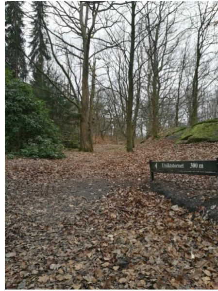
Figur 6b) Plats 9

Figur 6 (a, b). Bilder över platser som visar "Yta med färre ingrepp".