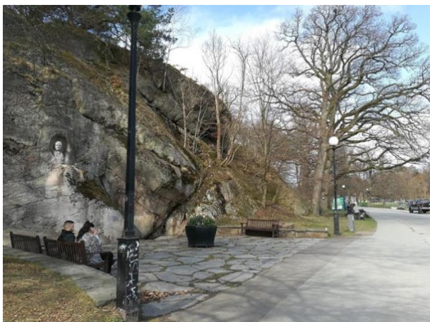
Figur 5a) Plats 5