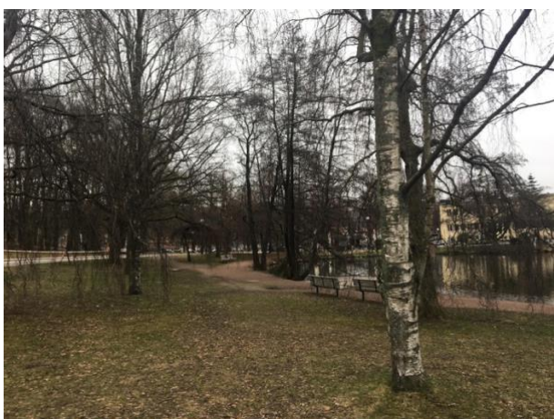
Figur 3c) Plats 7

Figur 3 (a, b, c). Bilder över platserna ”Öppen yta med fritt ändamål”.