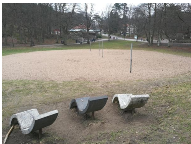
Figur 4a) Plats 3

Härnäst visas de två bilder som representerar platser över ”Öppen yta med tydliga ändamål, samt en resultatredovisning.