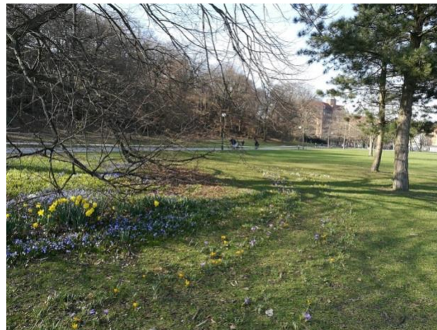
Figur 3b) Plats 2