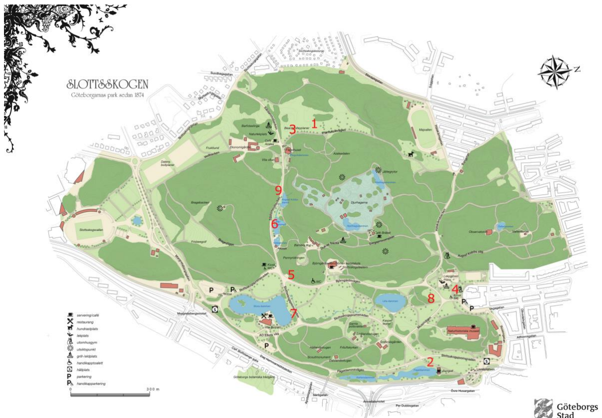
Figur 1 Karta över Slottsskogen, med markeringar i röda siffror över de platser studien baseras på.

Det grönområde som vår studie omfattar är Slottsskogen i centrala Göteborg, ett område som är stadens mest besökta park (Göteborgs Stad, 2017). Parken används för nöjen och vardagsliv, motionsträning men även för stora evenemang (ibid.).