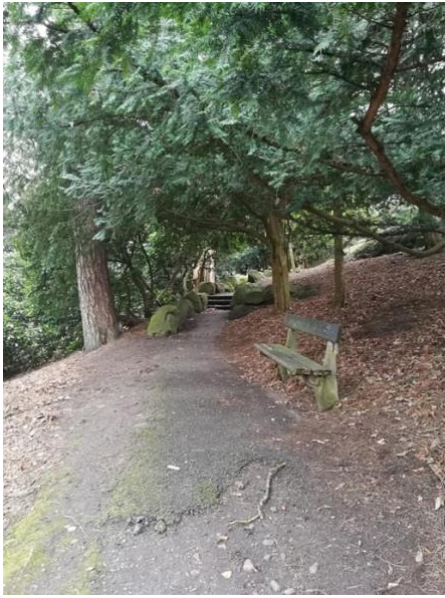
Figur 6a) Plats 8

Bilder som representerar platser över upplevelser av "Yta med färre ingrepp" visas härnäst, inklusive en resultatredovisning.