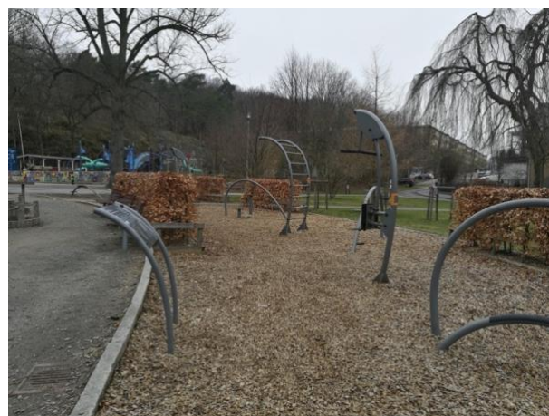
Figur 4b) Plats 4

Figur 4 (a, b). Bilder över platser med ”Öppen yta med tydliga ändamål”. Egna foton.