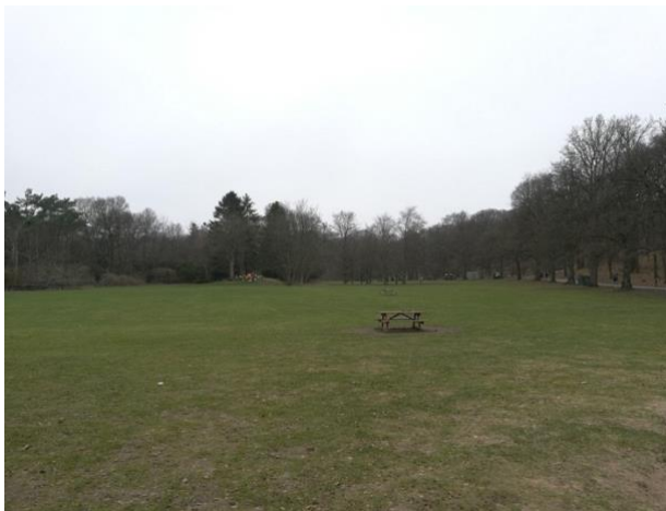
Figur 3a) Plats 1