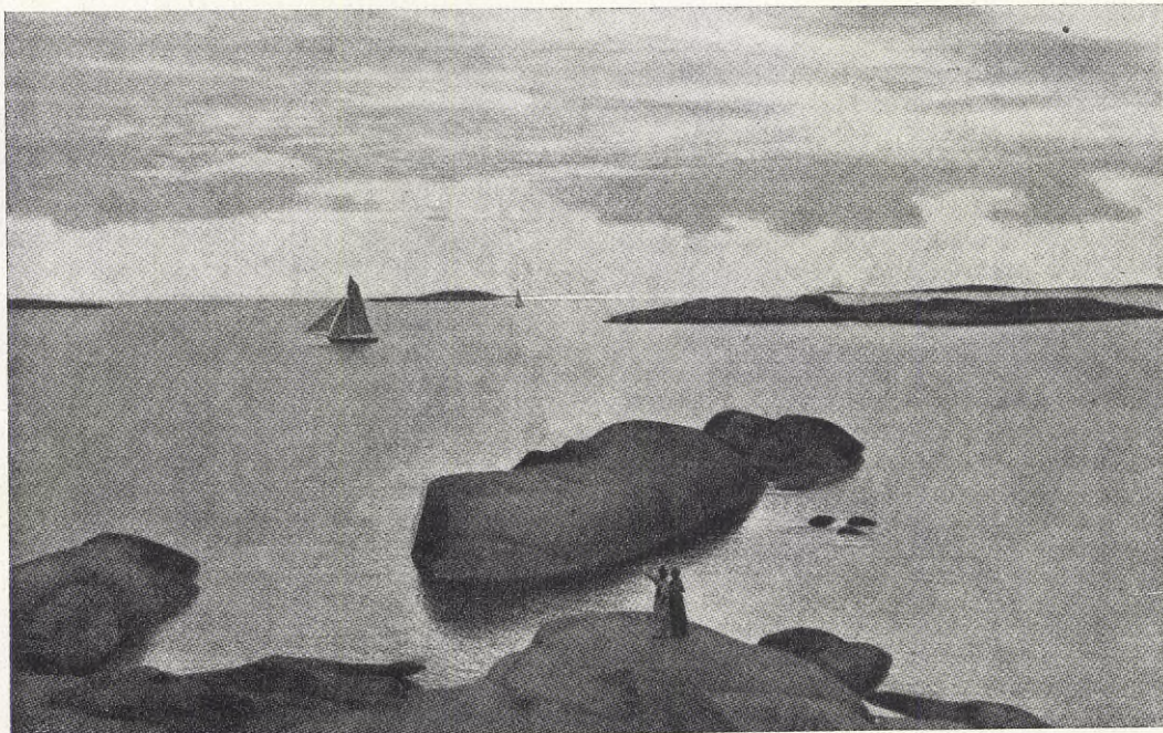
»Valen» vid Lysekil. (Ur Svenska bilder.)

vacker och begåvad flicka med gedigen bildning.