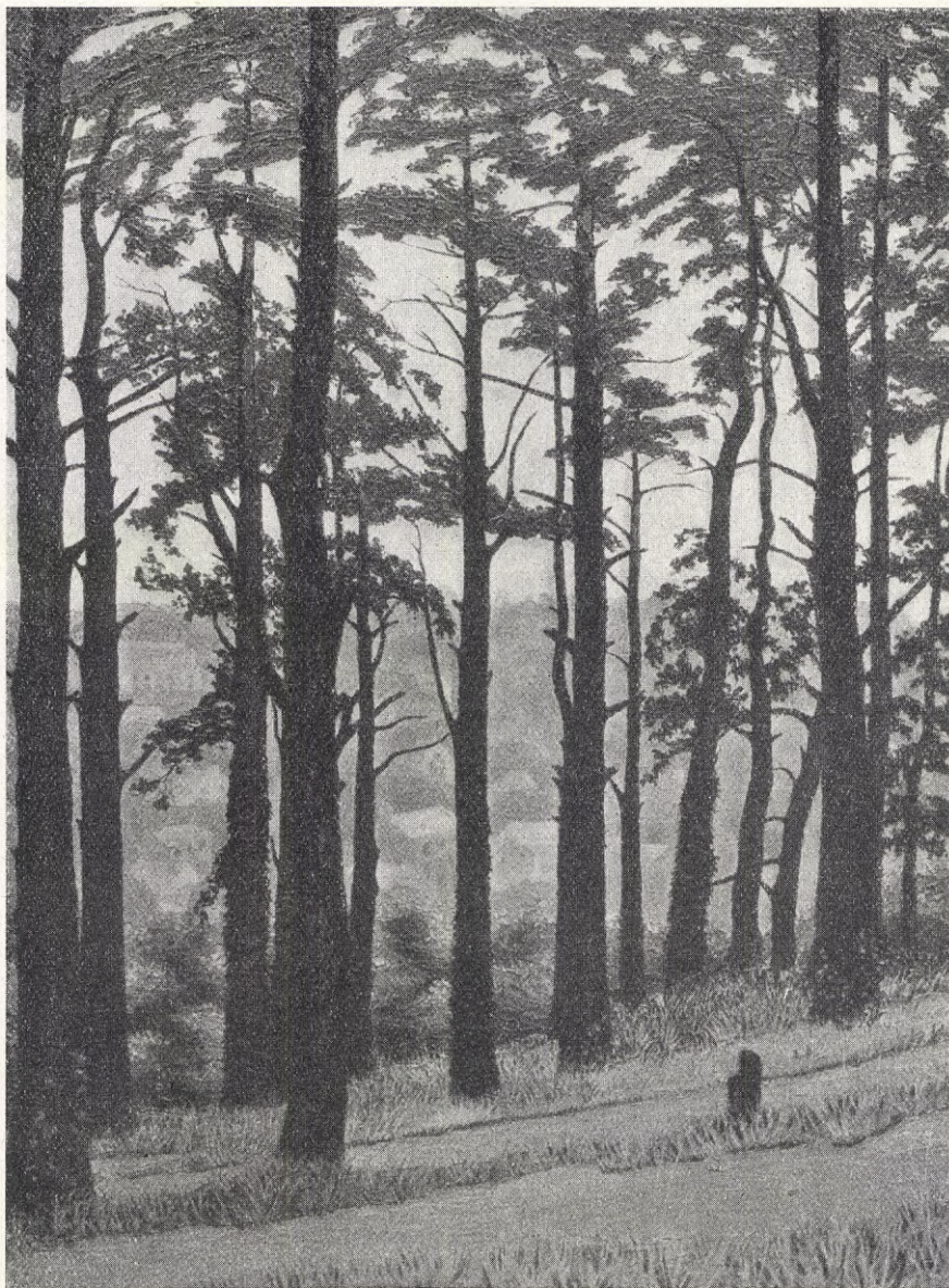
O'r Dickey: PARKMOTIV.

För behandling av de prostituerade kvinnorna har föreslagits bildande av hjälputskott till vilket de skola av tillsyningsmän anvisas att inställa sig. Hjälputskottet har därefter att avgöra om den inställda skall hänvi-