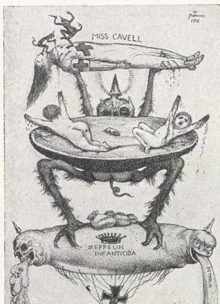
Prov på italienarnas ohyggligt fantastiska propaganda mot Tyskland.

Affischer, plakat och upprop togos i stor utsträckning i krigspropagandans tjänst. Krigsentusiasmen skulle uppeggas, krigslån skulle tecknas, sparsamhet iakttagas m. m., allt suggererades fram medels stora, skrikande plakat och affischer och mindre, agitatoriska broschyrer, pamfletter och upprop. I "Weltkriegsbücherei" finns icke mindre än 15,000 olika affischer och plakat, naturligtvis mest tyska, men även många från England, Frankrike, Italien, Ryssland m. fl. krigsländer, neutrala också för resten. Lärorika äro de under kriget (Forts. å sid. 12.)