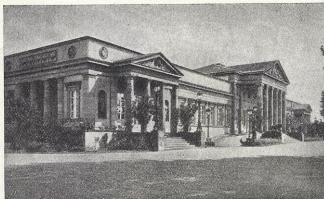
Slottet Rosenstein i Tyskland, i vilket världskrigssamlingarna äro.

Nu finns ungefär 80,000 böcker och broschyrer på 18 olika språk i "Weltkriegsbücherei", de flesta äro naturligtvis utkomna i bokhandeln, men det finns också en del privattryck och hemliga skrifter. Boksamlingen är uppdelad i 13 huvudgrupper med tillsammans 800 specialgrupper. Vill man veta något om U-båtskriget, slaget vid Somme eller matrosupproret i Kiel 1918, för att nämna ett par exempel, så är det lätt att leta reda på det i dessa specialgrupper. Och det finns litteratur om allt, ty under kriget voro pennfäktarna lika tappra som soldaterna i tröjan. Det finns omkring 5,000 tidskrifter, därav 1,300 på tyska språket, 186 franska, resten på engelska, italienska, spanska, ryska, polska, skandinaviska m. fl. språk. Tidningspressen fyller 12 stora salar och omfattar 2,150 olika tidningar på alla möjliga språk, därav 750 politiska dagblad, 400 tyska och 250 engelska, franska, italienska fält- och skyttegravstidningar.