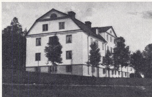
Alderdomshemmet i Långshyttan.