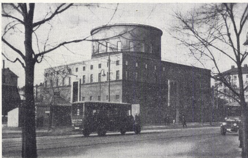
Det nya stadsbiblioteket i Stockholm.