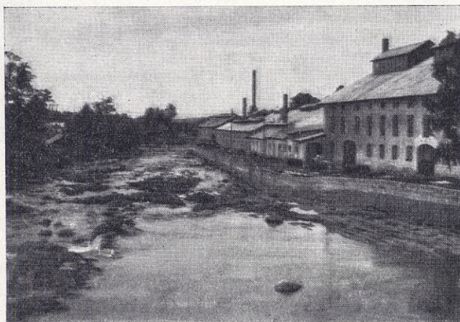
Vy från Hällefors.

än att sitta i en kall och ogästvänlig möteslokal.