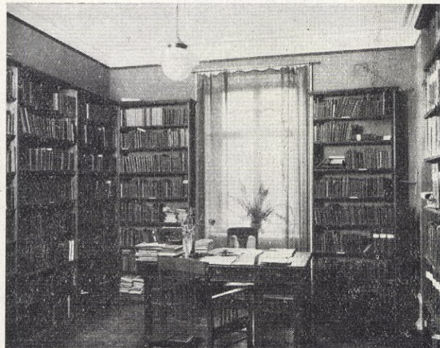
A. B. F:s lokalavdelnings studierum och bibliotek i Göteborg.

den, som väl alla Göteborgs vakna innebyggare känna till, äger Göteborg endast detta A. B. F.-hem, där studieintresserade i lugn och ro kunna samlas för att förkovra sitt vetande, för att sammanträffa med dem, som ha liknande intressen och för att under sällskapliga former fraternisera med sina medmänniskor. Att omgivningens skönhet och harmoni vid ett dylikt umgänge har en ofantligt viktig och kulturfrämjande uppgift är otvivelaktigt och även ur den synpunkten kunna Göteborgs arbetare vara glada över sitt nya A. B. F.-hem.