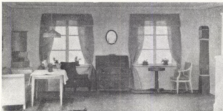
Rumsinteriör. Arkitekt: Carl Malmsten.

Tiden kostar som förut endast kr. 4: 80 för helår, kr. 2: 40 för halvår och 60 öre pr häfte. Prenumeration kan ske på posten, i bokhandeln eller direkt från Tidens förlag.