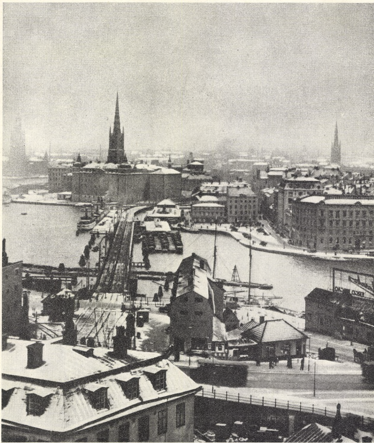
NYÅR ÖVER STOCKHOLM