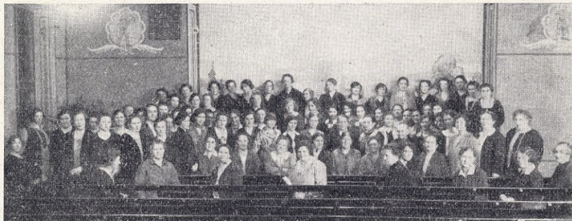
Från kamratmötet i Sundsvall.