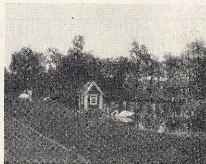
Folkets park i Mörrum.

Anmälningar mottagas kl. 12—4 å Internationella Kvinnoförbundets för Fred och Frihet byrå, David Bagares gata 9—11, 2 tr., Stockholm. Kursavgift för hela kursen 5 kr., för dagarna i Stockholm enbart 3 kr., för dagarna i Uppsala enbart 2 kr. Halvdagsbiljett 75 öre.