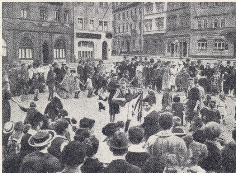
Bild från en dans- och lekstund med "Kinderfreunde" i en mindre stad i Tyskland.

ofta äro bundna av vanetänkande, vilket håller oss fångna i fördomar och falska föreställningar, och att den uppväxande generationen även får del därav vid uppfostran. Historieundervisningen med krigshjälteglorifieringen är ett exempel på den undervisning som är allt annat än opartisk, religionsundervisningen är ett annat område, där lärarens subjektiva uppfattning ofta ställes som norm för barnen. Börds- och börsaristokratiens uppfattning om "bättre" och "sämre" folk har trängt in i det allmänna medvetandet långt mer än man kan tro ibland. Se här ett litet exempel.