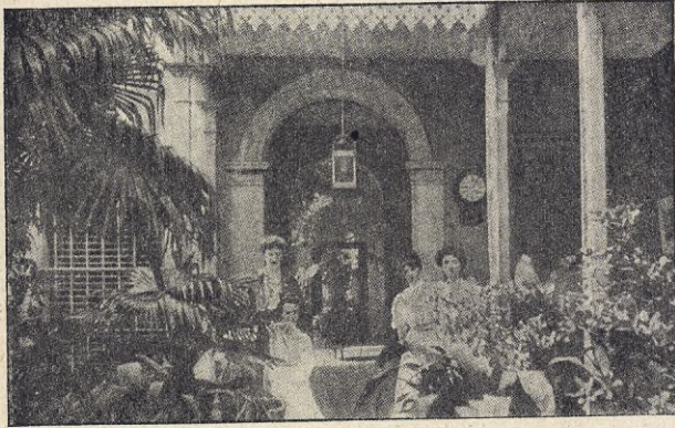
K. F. U. K:s INTERNATIONELLA HEM I BUENOS AYRES.

för dem, som vistas i främmande land af en eller annan anledning. Så finnes t. ex. — för att endast nämna några af dem — internationella hem i Paris och Rom för studerande vid universitet och konstskolor, och nere i det mörka Afrikas folkrikaste stad Kairo har föreningens hem sedan 1903 utgjort en samlingspunkt för unga kvinnor från olika län-