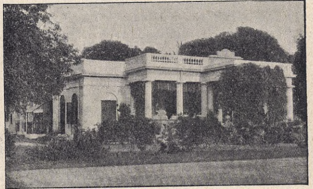
HEM FÖR STUDERANDE I MADRAS.