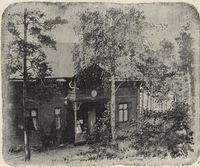
Edensborg, Centralföreningens sommarhem på Lidingön.

För något öfver en månad sedan invigdes på Södra K. F. U. K. i Stockholm ett trefligt inbjudande hem för arbeterskor och endast ett par veckor därefter ett liknande å Centralföreningens filial i Maria församling. Beläget i industriarbeterskornas väg har detta hem liksom systerföreningen satt som sitt mål att vara en