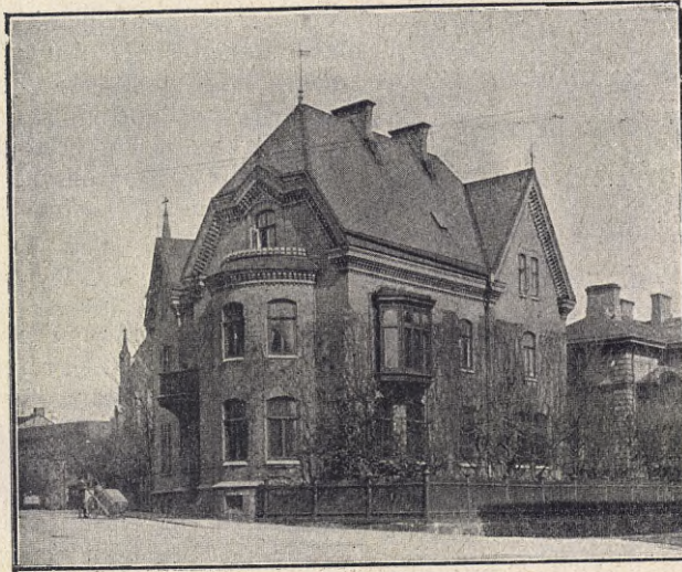
K. F. U. K:s HEM I GÖTEBORG.

alla delar af Europa, och ingen ung kvinna, som därifrån kommer till denna stad, står utanför hennes personliga intresse och inflytande. Efter ett års arbete hade föreningen nära 300 medlemmar, representerande 14 olika nationer, och i dess hem rymdes 24 inackorderade. Restaurang och platsbyrå finnes där. De flesta människor komma till Buenos Ayres för att förtjäna pengar, en materialistisk anda är rådande, irreligiositeten är allmän och njutningslystnaden är vidt utbredd. K. F. U. K:s fyrfaldiga