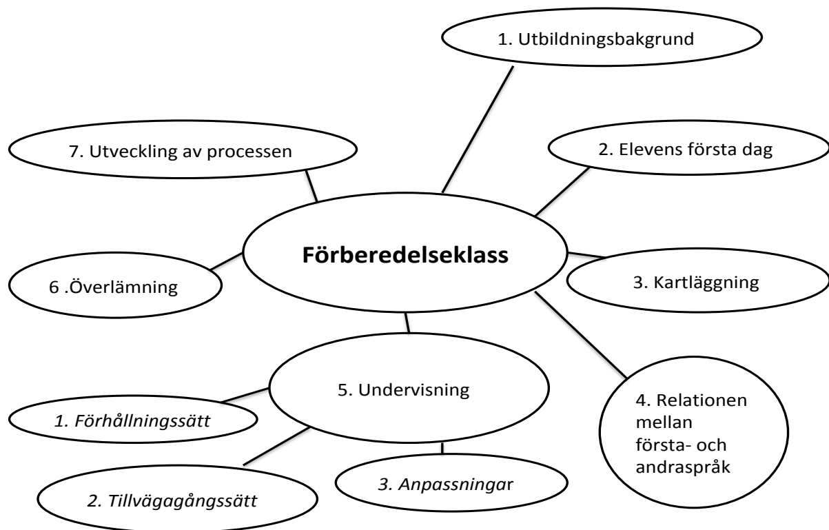
Figur 2. Tankekartan som den presenterades för informanterna.

Inför mötet med lärarna bedrevs en mailkonversation, på det sättet fick lärarna tillgång till tankekartan (fig. 2) innan första mötet. Syftet med att tankekartan varit utformad efter en viss ordning har varit att ge informanterna en enkel och tydlig struktur att utgå från, om någon av dem skulle ha ett sådant behov. Emellertid har de som intervjuats fått frihet att röra sig mellan de olika temana då det finns kopplingar mellan dessa. Det har även funnits möjlighet att gå tillbaka till ett tema som tidigare har behandlats. Detta är något som Bryman (2011) påtalar som karaktäristiskt för kvalitativa intervjuer då det finns en öppenhet för att föra en fri diskussion. Tankekartan har varit ett medel för att uppnå just den effekten. Intervjuerna har skett på respektive skolor i lokaler som fanns att tillgå. Två av dem skedde inte i lugn miljö då det var brist på lokaler.