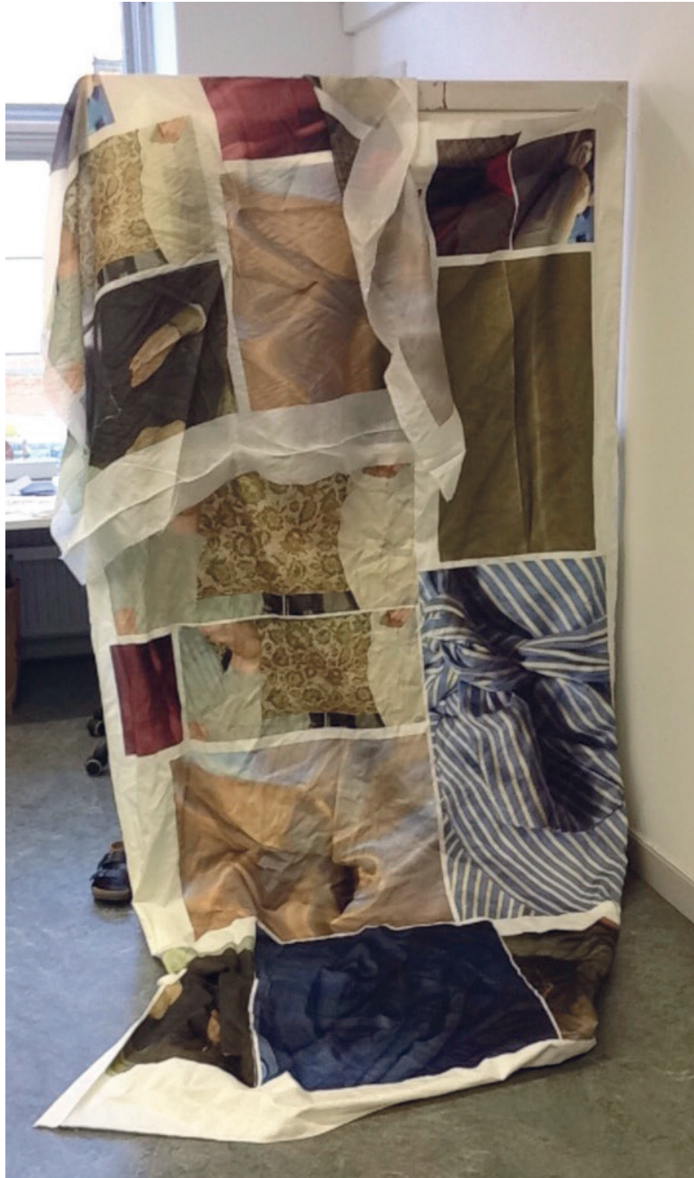
Det första utskrivna materialet.