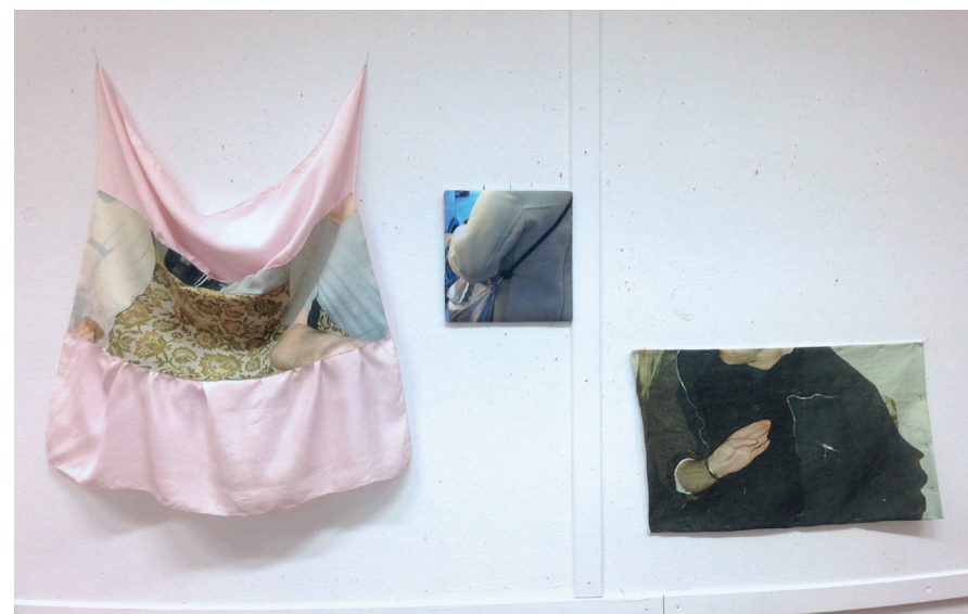
Ideérna och skisserna börjar växa fram.