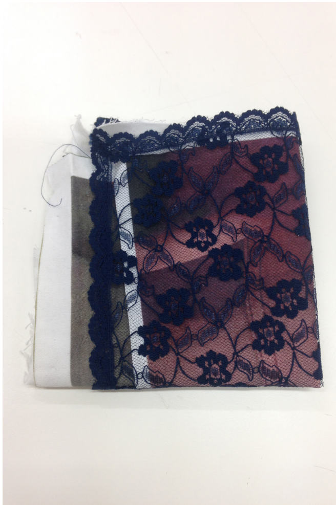
Bearbetning av sjalar.