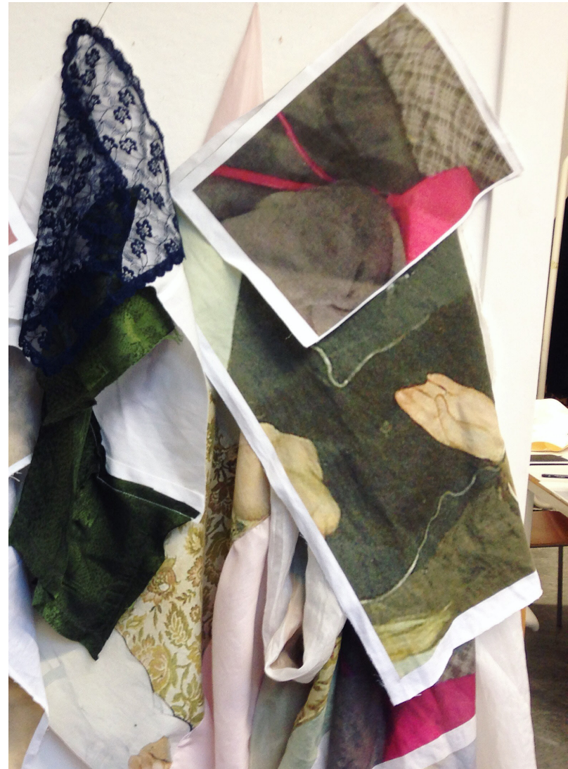
Det första utskrivna materialet.