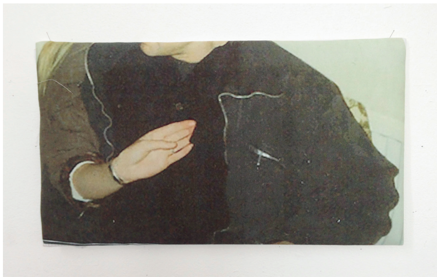
Bild fylld med vadd.