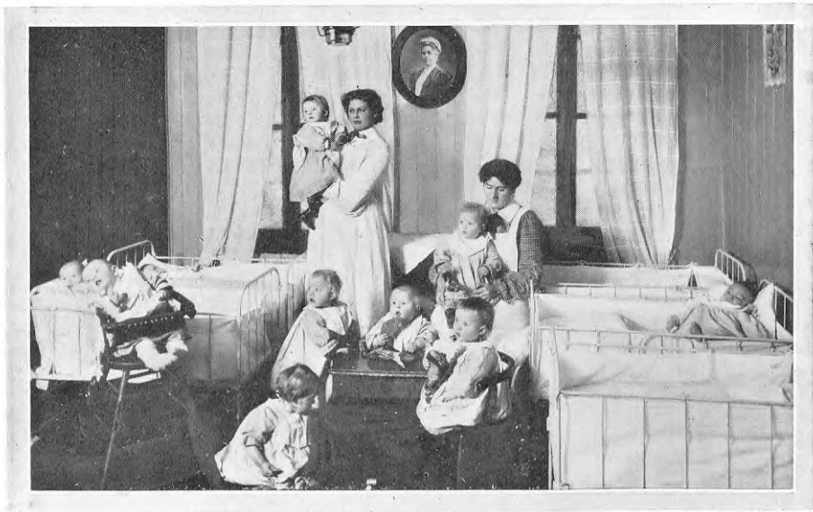
Myrornas Barnhem N:o 6. Lisen Levissons hem för späda barn.

Att få ett sådant till stånd hade länge varit Myrornas önskemål, vilket nu kunde realiseras genom den donation å tjugotusen (20,000) kronor, som till fru Levissons minne överlämnades av hennes närmaste. Då hennes make, konsul Ludvig Levisson, följande år avled, ökades donationen ytterligare genom en gåva å tiotusen (10,000) kronor av den avlidnes barn.