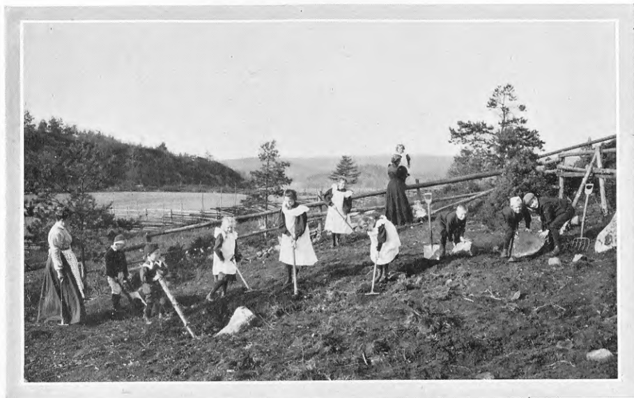
»Här ska' bli potatis till nästa år!» Myrbarnen rödja mark på Solbacken.