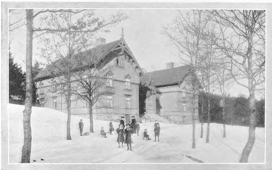
Myrornas Barnhem N:o 4, Skogshyddan.