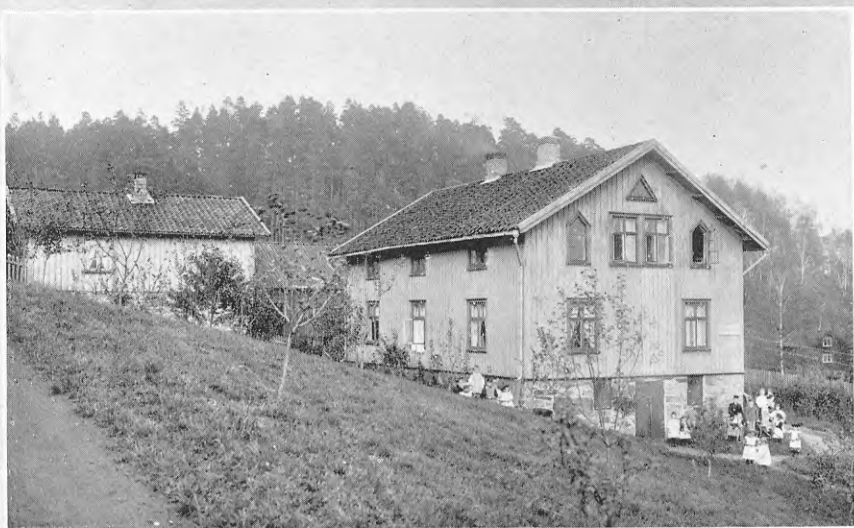
Myrornas Barnhem N:o 7, Födelsedagen.