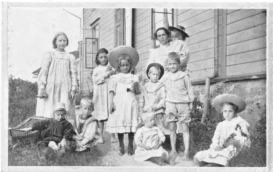
Myrornas Barnhem N:o 5.