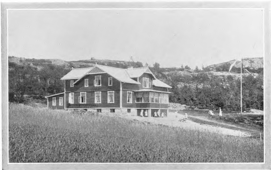
Myrornas Barnhem N:o 1, Solbacken.