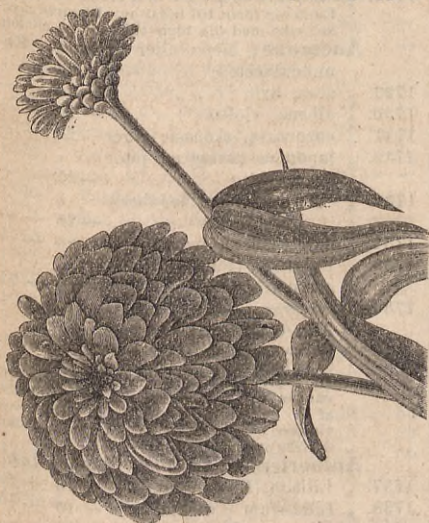
Zinnia Haageana fl. pl.