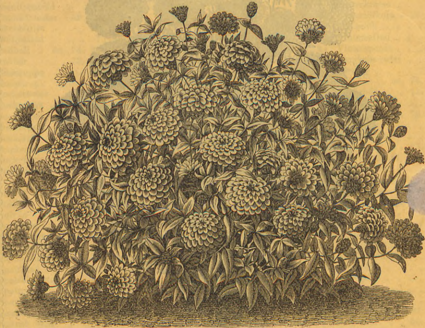
Zinnia Haageana fl. pl.