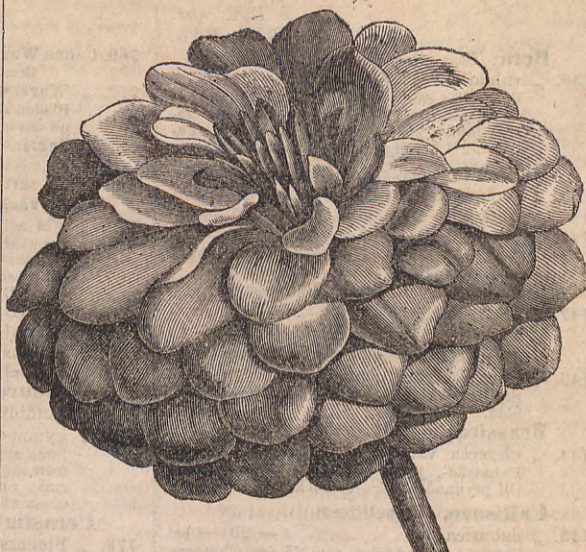
Zinnia elegans flore pleno.