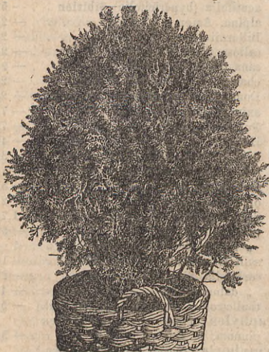
Thuja orientalis aurea.