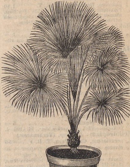
Livistona ( Latania .)