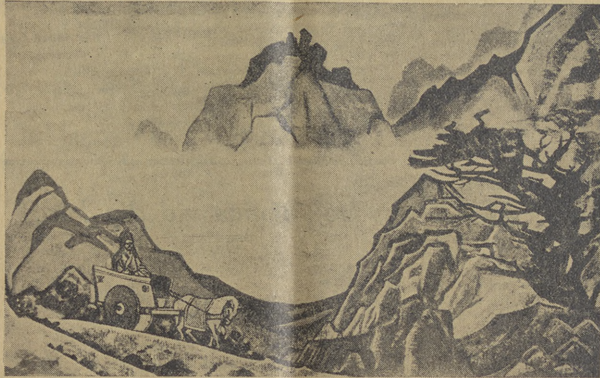
NICHOLAS ROERICH: Himalaya.