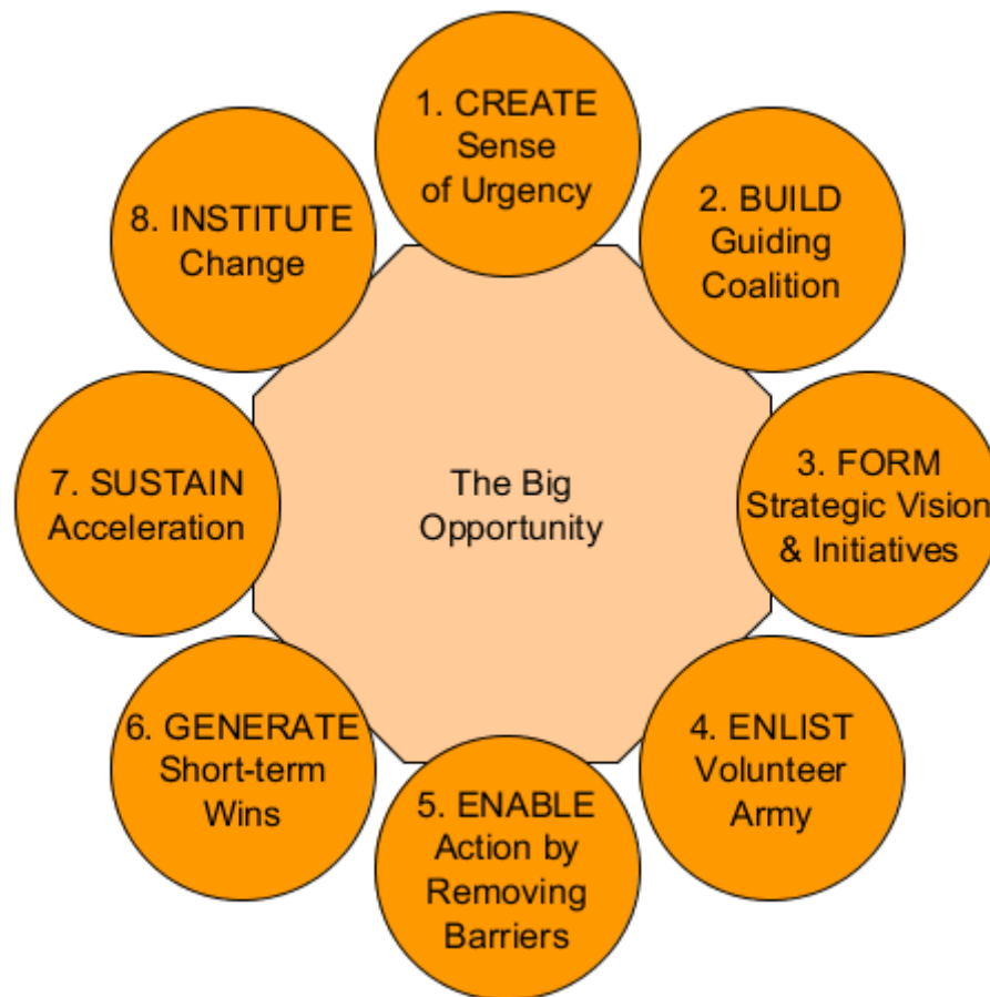
Figur 2: Kotters 8-stegsmodell (Kotter International, 2015).