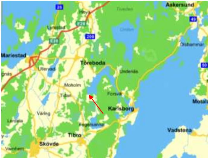
Fig. 1 Karta som visar Ryholms läge vid sjön Viken, som är en del av Göta Kanal, och som binder samman Väner och Vättern. (Eniro, 2016)