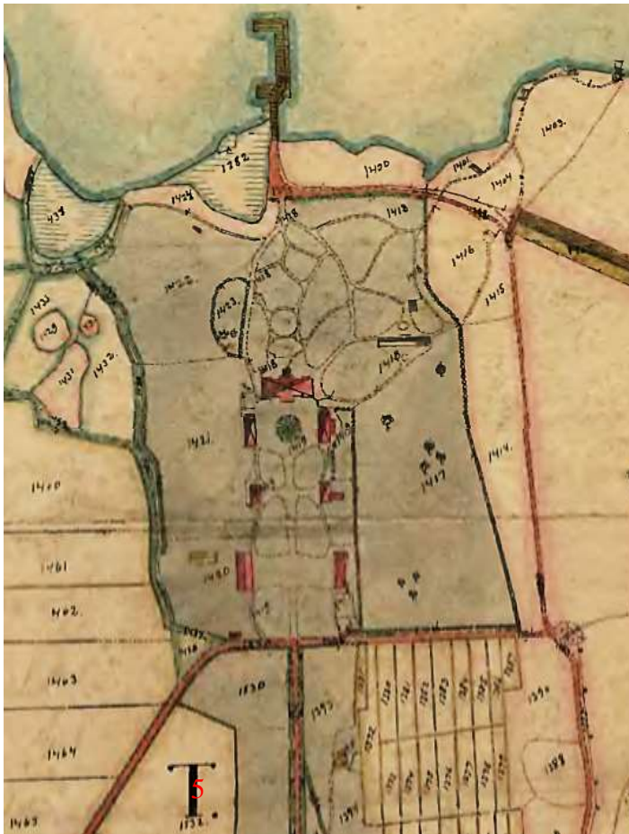
Fig. 8 Laga skifteskarta 1911, 16-BEA-54 (Lantmäteriet, 2016)

På Laga skifteskartan från 1911 (fig. 8), är både park, trädgård och orangeri noga utritat. Här syns också tydligt gårdsrundelns blomlika form. Följande beteckningar är markerade som tomt med trädgård: nr 1417, 1420-21, -23, park med gångar: 1418-19, park: 1422. Här finns inga vinkast utritade på kartan, men troligtvis finns de där redan.