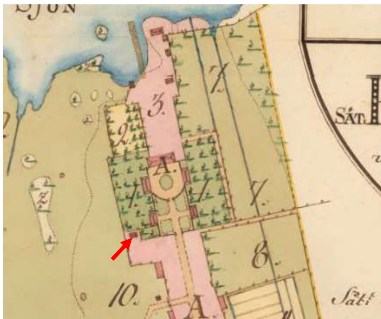
Fig 6 Storskifte 1793, Beatebergs socken Ryholm nr 1 Pilen visar det som kan vara ett av vinkasten. (Lantmäteriet 2016)

Nästa karta från 1793 (fig. 6) visar två stycken träd- och kryddgårdar som nr 1, nr 2 visar en humlegård och nr 3 betecknas som en plats norr för mangården, varpå brygghus och smedja är uppbyggt. Vägen är här utträtad till en allé och det finns en gårdsrundel framför huset och gräsytor mellan flyglarna. Den lilla byggnaden (se röd pil) verkar ligga på samma ställe som ett av vinkasten, numera poolhus, och det kan tyda på att en del av vinkasten är från denna tid.