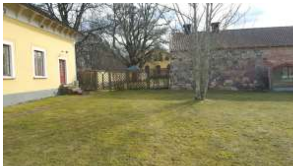
Fig.15 Baksida av poolhuset, byggt delvis av material från de gamla vinkasten. I bakgrunden syns den delvis murengårdade gamla bänkgården och bortanför den, gaveln på stallflygeln.

På Ryholm finns inga uppgifter om när och av vem vinkasten på västra sidan uppfördes. Resterna av dessa vinkast är idag ombyggda till ett poolhus (fig. 15). Dessa ska dock ha bestått av samma sorts byggmaterial som övriga hus på Ryholm och borde av den anledningen funnits här redan på 1800-talet och eventuellt finns de med redan 1793 (se fig 6). Skulle det uppförts senare borde det byggts av det egentillverkade teglet på gården, (Informant 4)