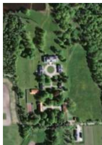
Fig. 2 Satellitbild över Ryholms gods och dess inägor, d.v.s. de områden som innefattade trädgården 1850-1950.

Tidsperioden är vald med tanke på att det under detta sekel har funnits källmaterial att arbeta med och är för övrigt en intressant period i Ryholms trädgårdshistoria. Under mitten och slutet av 1800-talet gjordes stora satsningar både i park och trädgård och under 1900-talet utarrenderades en del av trädgården, vilken drevs som handelsträdgård. När det gäller Ryholms ägarförhållanden har mest fokus lagts på de två