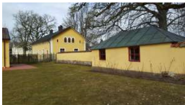
Fig. 16 Det inbyggda huset i muren, kanske ett lagerhus för frukt, "apple store". Ryholms gods (Foto: Åsa Svensson, 2016)

Var dessa drivbänkar var placerade finns inte noterat, men kan möjligen ha varit placerade på samma ställe som bänkgården på 1940-talet. När bänkgårdens mur som avskärmar mot öster byggdes har inte kunnat fastställas. I muren finns en litet inbyggt hus/förråd (fig. 16) och som skulle kunna liknas vid den viktoriaiska trädgårdens "apple store", lagerhus för frukt (Hansson 2011, s. 143).