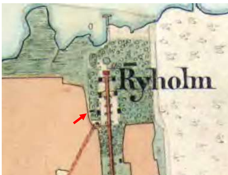
Fig. 7 Häradsekonomisk karta 1877-1882, Ryholm J112- 54-116. Pilen visar en byggnad, troligtvis ett vedförråd (Lantmäteriet, 2016)