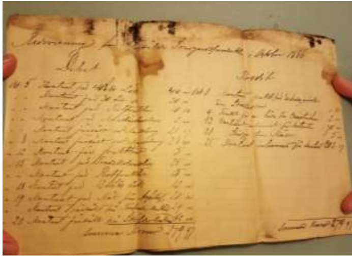
Fig. 17 Utdrag ur kassaboken, i löslblads format, från Ryholms gårdsarkiv, Landsarkivet Göteborg