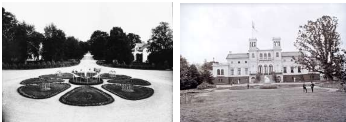
Fig. 3-4. Några av Ryholms nyanläggningar, till vänster: Gårdsrundeln framför huvudbyggnaden, i form av en blomma, årtal 1904. Fotograf P.A. Eriksén ( Jansons arkiv). Till höger: Slottsparken med gångar, statyer och planteringar, sett från sjösidan, årtal : 1880-tal. Fotograf: P.A. Eriksén ( Västergötlands museums bildarkiv)

Inte bara jordbruket hade utvecklats, en två kilometerlång kastanjeallé, en gårdsrundel som fransk parterre i form av en blomma (fig.3), en engelsk park (fig. 4), ett stort orangeri med otaliga krukväxter, vinrankor, persiko- och aprikosträd, en stor fruktträdsplantering och stora frilandodlingar fanns nu vid Ryholm och som sköttes av trädgårdsmästare och ett antal trädgårdselever och –drängar.