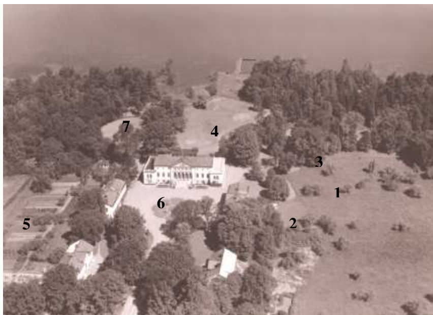
Fig. 10 Flygfoto över Ryholm, år 1953. Fotograf: AB Flygtrafik, Dals Långed 1: Frukträdgården 2: Odlingsyta utanför östra flygeln 3: Platsen för orangeriet 4: Parken, 5: Frilandodlingarna, 6: Gårdsrundeln, 7: Platsen för gamla humlegården 1763 (Jansons arkiv)

Flygfotot (fig. 11) är troligtvis från början av 1980-talet när Ryholm låg ute till försäljning och även om trädgården förfallit sedan familjen Janson lämnade godset 1979, så syns spåren av frilandsodlingarna på västra sidan (1) tydligt. Det tycks skimra några fruktträd (2) i den gamla fruktträdgården på östra sidan men det flesta tycks vara borta. Rundeln (3) verkar ha kvar sin form även om den ser något igenväxt ut. Den gamla bänkgården söder om frilandsodlingen och vinkasten (4) syns tydligt.