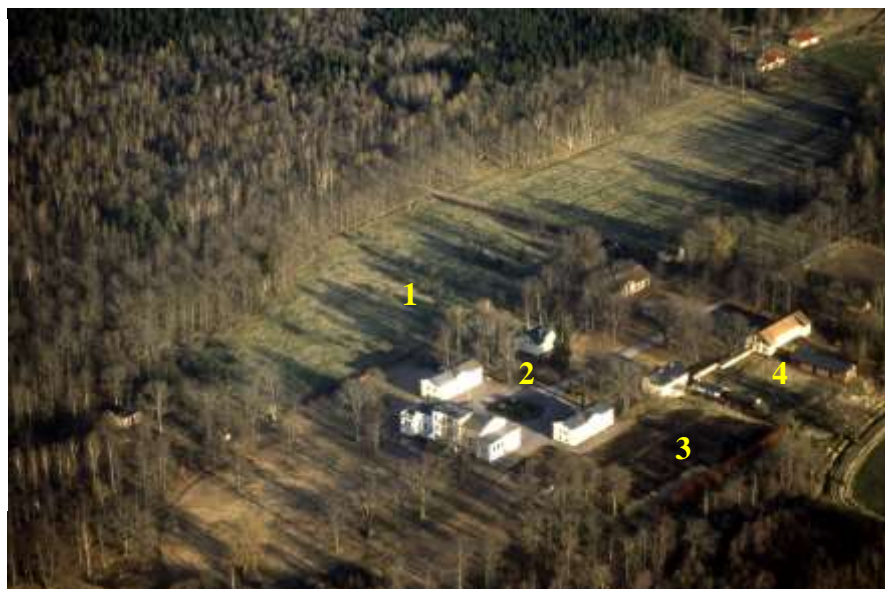
Fig. 11 Flygfoto över Ryholm från nordväst, år 1982. 1: Gamla fruktträdgården 2: Gårdsrundeln, 3: Gamla frilandsodlingarna, 4: Forna bänkgården

Flygfotot (fig. 11) är troligtvis från början av 1980-talet när Ryholm låg ute till försäljning och även om trädgården förfallit sedan familjen Janson lämnade godset 1979, så syns spåren av frilandsodlingarna på västra sidan (1) tydligt. Det tycks skimra några fruktträd (2) i den gamla fruktträdgården på östra sidan men det flesta tycks vara borta. Rundeln (3) verkar ha kvar sin form även om den ser något igenväxt ut. Den gamla bänkgården söder om frilandsodlingen och vinkasten (4) syns tydligt.