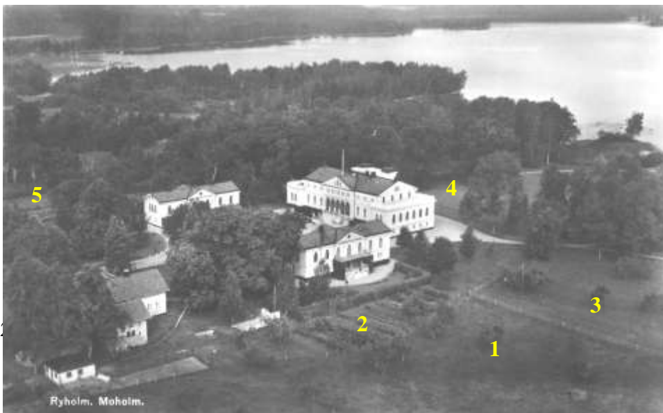
Fig. 9 Flygfoto över Ryholm, årtal okänt. Eventuellt 1930-tal. 1: Fruktträdgården 2: Troligtvis bärträdgård 3: Platsen för orangeriet 4: Parken, 5: Frilandsodlingarna

Flygfotot (fig 9) är troligtvis från 1930-talet (Informant 2). I den gamla fruktträdgården (1) finns fortfarande en del fruktträd kvar. Utanför nordöstra flygeln som är omgärdad av en häck (2) syns någon form av odlingsyta, verkar vara en del buskar, så det kan tyda på en bärträdgård. Östra delen av parken (3) är platsen för orangeriet, och här syns ingen byggnad så troligtvis finns det inte kvar när detta foto tages. Vägen fram till orangeriet syns tydligt iallafall. I parken verkar inte de slingrande gångarna finnas kvar, utan det ser ut som någon form av klippt gräsyta. På västra sidan om flyglarna (5) skymtar frilandsodlingarna.