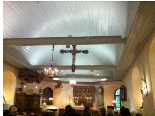
Fig. 9. Torslanda kyrka. Diana Olausson Öberg 2016.