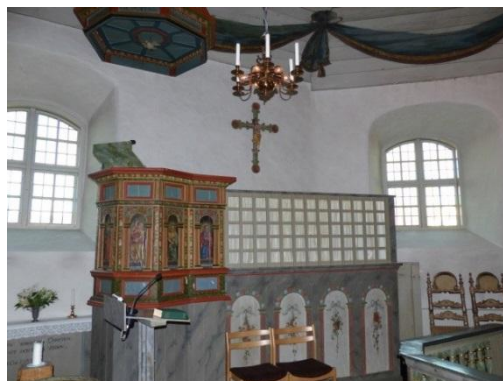
Fig. 2. Mariakyrkan, Öckerö. Amanda Öberg, 2016.