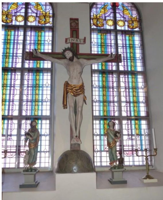
Fig. 10. Marstrands kyrka. Amanda Öberg, 2016.