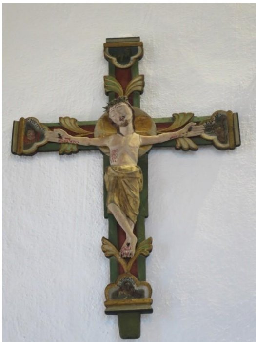
Fig. 6. Romelanda kyrka. Diana Olausson Öberg, 2016.