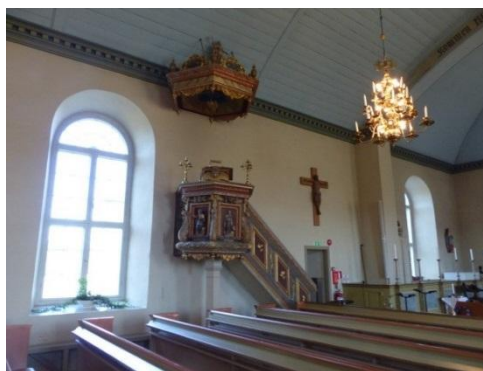
Fig. 4. Torsby kyrka. Amanda Öberg, 2016.