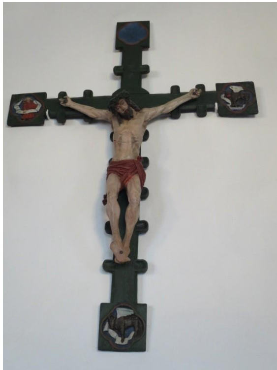
Fig. 12. Håлта kyrka. Diana Olausson Öberg 2016.