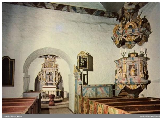
Fig. 18. Bokenäs g:a kyrka.