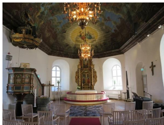
Fig. 7. Romelanda kyrka. Diana Olausson Öberg, 2016.