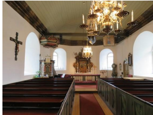
Fig. 13. Håлта kyrka. Diana Olausson Öberg 2016.