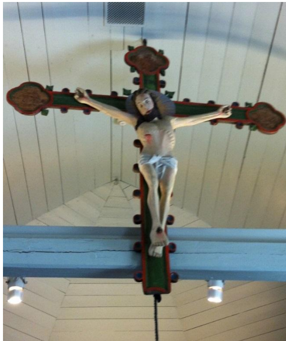
Fig. 8. Torslanda kyrka. Diana Olausson Öberg 2016.