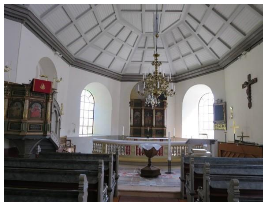
Fig. 15. Spekeröds kyrka. Diana Olausson Öberg 2016 .