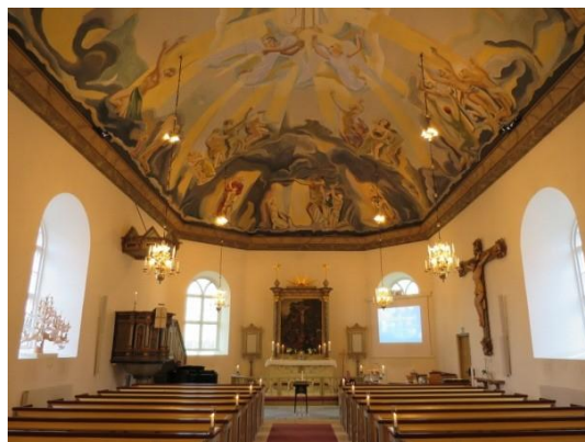
Fig 17. Foss kyrka. Diana Olausson Öberg 2016.