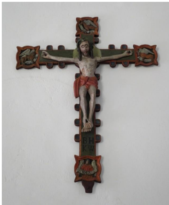
Fig. 14. Spekeröds kyrka. Diana Olausson Öberg 2016.