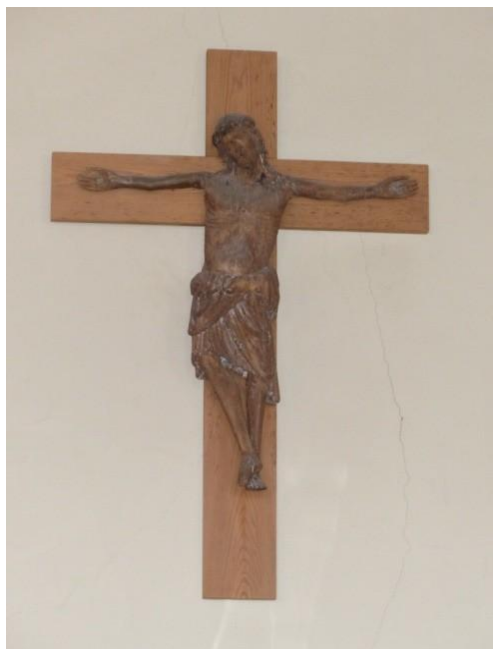
Fig. 3. Torsby kyrka. Amanda Öberg, 2016.