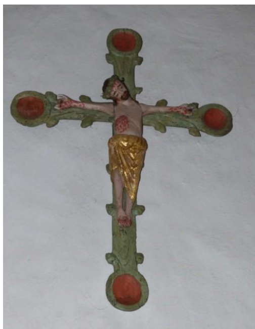
Fig.1. Mariakyrkan, Öckerö. Amanda Öberg, 2016.