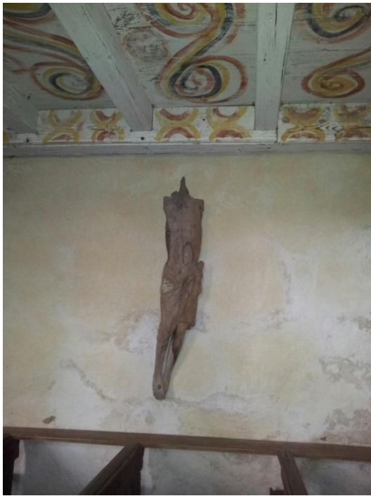
Fig. 5. Svenneby g:a kyrka.