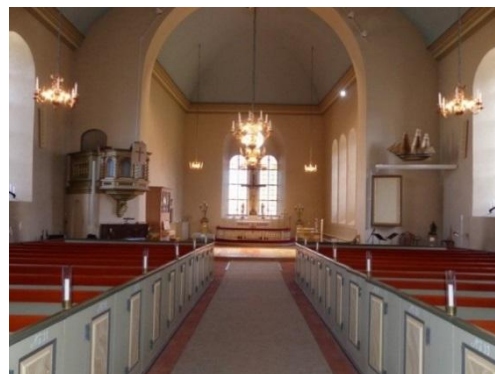
Fig. 11. Marstrands kyrka. Amanda Öberg, 2016.