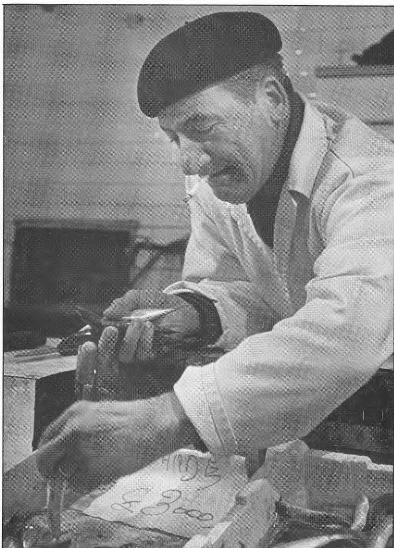
Övervägande delen av de äldre kooperativen arbetar med livsmedel.