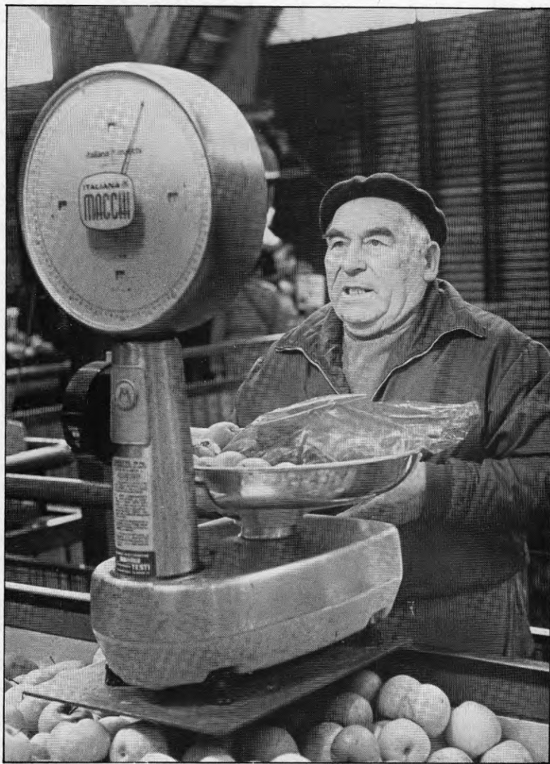
Grönsakshandel sker ofta i kooperativ form.