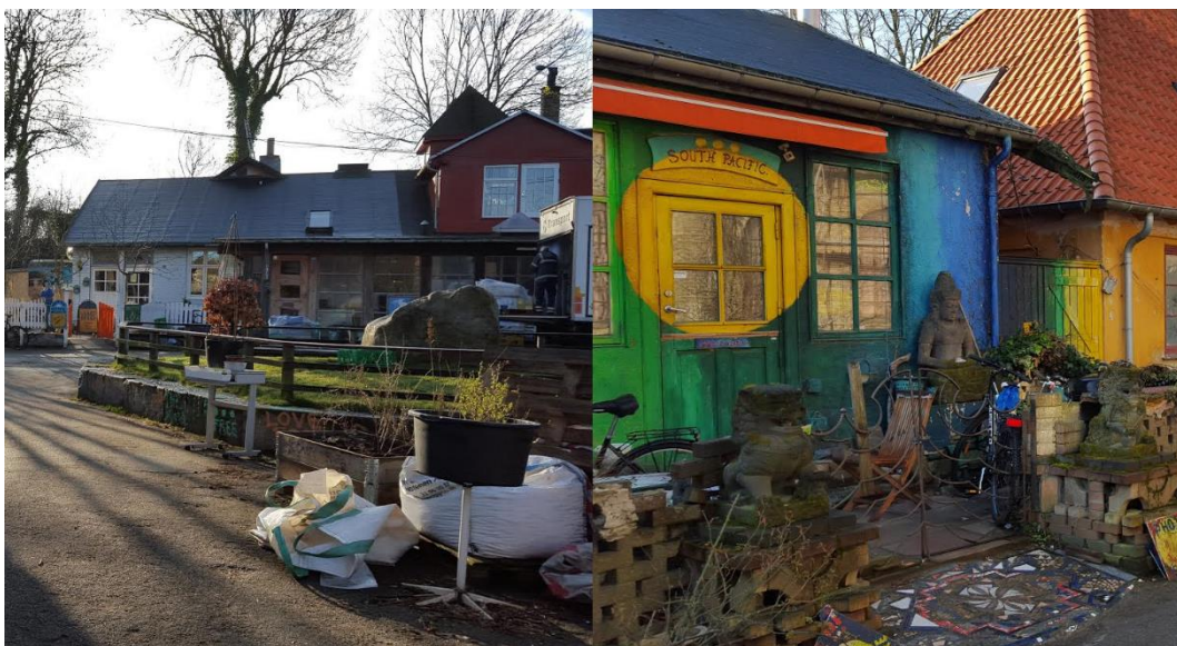
Figure 2 Colourful and unique architecture in central Christiania (photos by author, March 2016)

Man lekte med det urbana och byggde tidigt små domer, pyramider, hus av flaskor mm. som utmanade distriktets gamla former och färger. En respondent berättar exempelvis om att man kunde komma över en dörr eller ett fönster från något rivningsprojekt som inspirerade en till att börja föreställa sig hur den här dörren eller det här fönstret skulle passa in i ett hus. Man tog tillvara på vad man kom över och improviserade för att lösa problem. Spår av den här kreativa friheten går fortfarande att observera i landskapet som graffiti eller unika och ibland egendomliga huskonstruktioner. Även om den här tidiga typen av radikal omvandling kanske inte är lika aktiv eller intensiv längre är det ändå något som urskiljer Christiania från omgivningen. ”Det er anderledes, det er en anden kultur, vi har en egen kultur her” , som en respondent berättar när jag påpekar det visuella intryck Christiania gjort på mig.