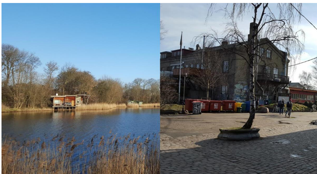
Figure 3 Rural and urban Christiania

Asfaltsvägarna och kullerstenen övertas av grus och Mark Knopflers gitarrgnetande ersätts snart av fågelkvitter och en stillhet (eller kanske borde jag snarare säga "the sound of silence" nu när vi ändå är inne på 70-talshits?). De här mer rurala delarna som ligger belägna på de gamla försvarsvallarna demonstrerar inte bara en skarp kontrast till centrumområdet utan även en intern mångfald. Å ena sidan påminner doften av bränt trä och högarna av bråte mig om kåkstäderna i globala syd, å andra sidan blir jag så tagen av skönheten och originaliteten hos flera av de unika kreationerna att jag inte kan göra annat än hålla lite utkik efter Kevin McCloud från det brittiska tv-programmet Grand Designs . Han dök inte upp, men Christiania visar ändå upp en imponerande mångfald för ett så litet område mitt i Köpenhamn. Det är sannerligen en plats präglad av kontraster och mångfald på flera sätt.