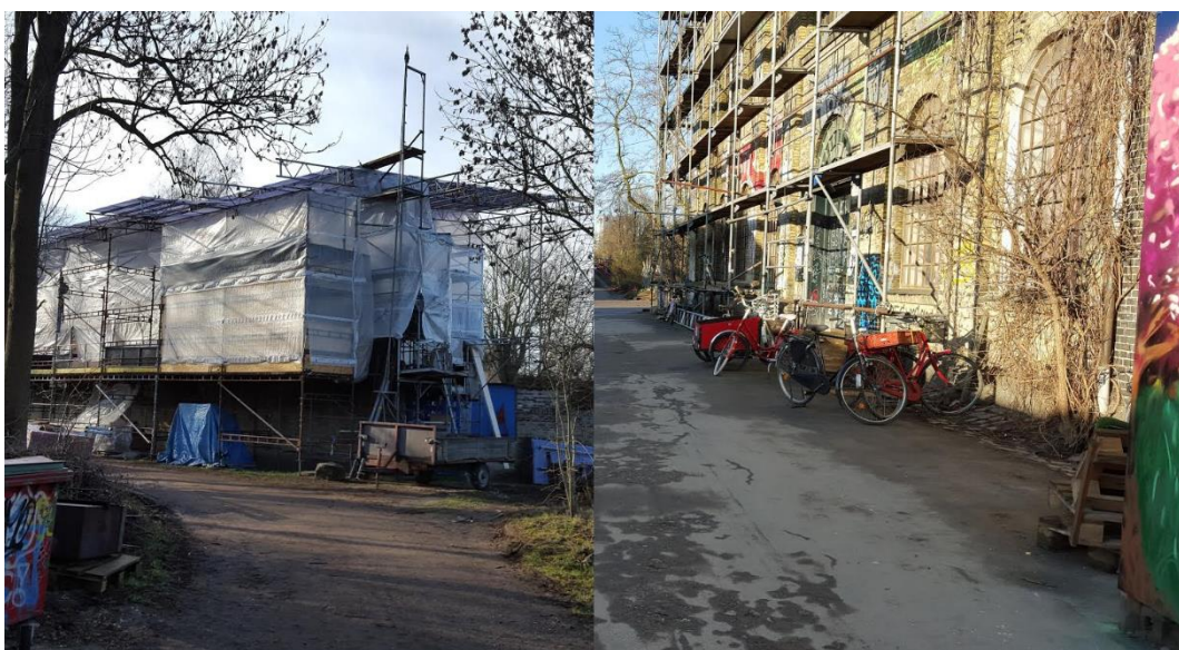
Figure 4 Restoration in Christiania