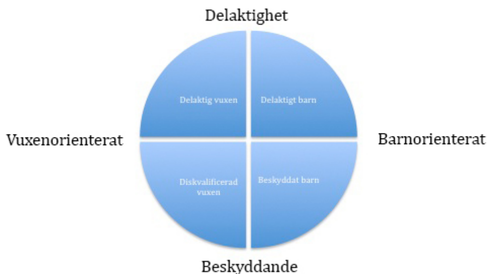
Figur 2: Eriksson och Näsman (2011:44) modell för utredares bemötanden och barns delaktighet.

Eriksson och Näsman (2011) menar att barn kan sättas i olika positioner utifrån hur mycket delaktighet de ges utrymme till av utredaren i myndighetsprocesser utifrån Harts modell. De två aspekter som författarna väljer att fokusera på är framförallt i hur stor utsträckning som barn informeras och konsulteras i utredningssammanhang, samt i hur stor utsträckning som utredaren har fokus på barnet och anpassar sig efter barnets behov och vilja i en utredning. Dessa presenteras i en korstabell, där den vertikala axeln benämns som delaktighet kontra beskyddande, medan den horisontella axeln benämns som vuxenorienterat kontra barnorienterat.