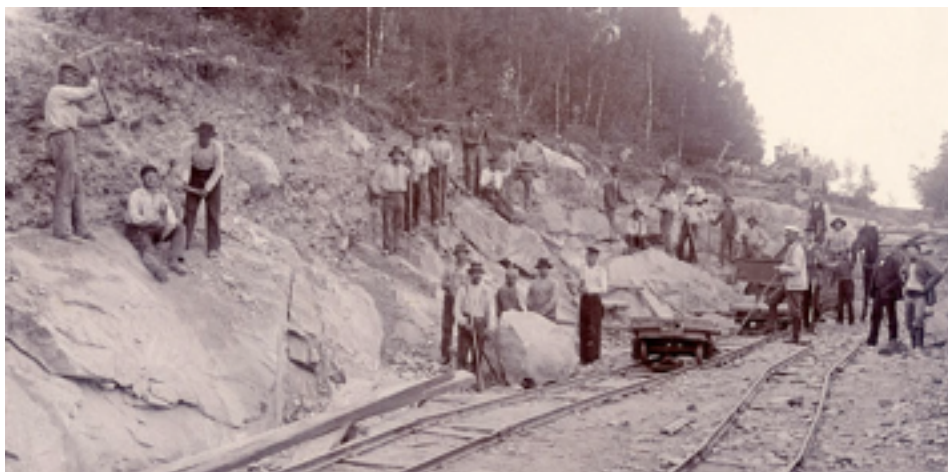
Figur.1 År 1901 järnvägen mellan Stockholm och Nynäshamn färdigställs.

För ungefär 1 800 miljoner år sedan var Södertörn en gedigen bergskedja och när bergen sedan eroderat ned övergick landskapet till en klippöken under brännande sol. I samband med att landet sjönk några hundra miljoner år senare bildades ett mycket rikt tropiskt hav på platsen, fossiler i kalkberggrunderna på Gotland berättar om ett omfattande liv. En slutsats som sedan kan dras enligt Gunnar Norberg, är att det inträffade omfattande jordskalv vilket medförde att landet åter höjde sig. Istiden för 70 000 år sedan bildade jättegrytor och slipade bergen när vattenströmmar med virvlande grus forsade fram (Norberg, red.1996 s.11) Dessa spår finns det gott om längs Nynäshamns berghällar och stränder, vilket i sig resulterat i en mycket vacker och historisk miljö. Det har bott människor här länge, gravhögar man hittat dateras ända till bronsåldern (1 800 till 600 f.Kr). Nynäshamn som tätort bildades däremot för ca 100 år sedan och var då en köping. Stadsprivilegier erhöles 1946 (Norberg, red.1996 s.143).