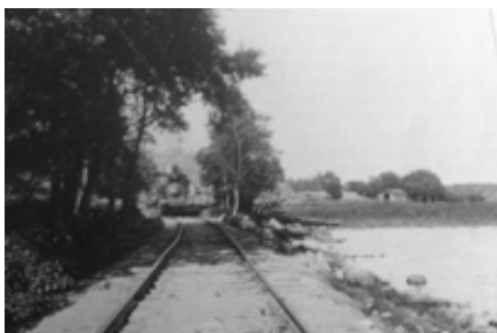
Figur. 8 Dragning av räls vid nuvarande inre västra gångbana 1900-talet.

Förklaring: Samhällshistoriska värden är immateriella värden, de kan avspegla hur platsen medvetet använts i en viss tidsanda som sedan följt samhällsutvecklingen generellt. Stadsbyggnadshistoria är ofta knuten till hur platser avsiktligt uppkommit och hur människan i förlängningen sedan tagit dem i bruk. Parker och andra grönytor avspeglar ofta en viss politik och tidsanda.