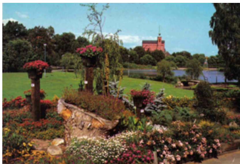
Figur. 10 På bilden ses en del av ”Göstas” trädgård, i bakgrunden syns lite av parkens utformning med slingrande vägar och små broar. Bilden är mycket representativ för Nynäshamn då denna vy ofta förknippas med staden.

Förklaring: Parkarkitektur beskriver en avsiktligt planerad grönyta. Ytan har ofta en viss ”stil” såsom Barock, engelska parker eller naturparker. En stil som ofta förknippas med parkens grundare. Även växtmaterialet har här en betydelse, olika växtmaterial har haft sin egen kulmen. Arkitekturen och växtmaterialet kan tillsammans skapa en mönsterbild över parkens olika ytor.