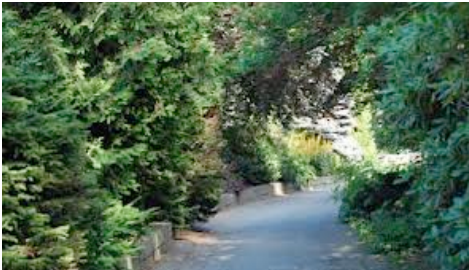
Figur.16 Bilden avspeglar en del av Göstas trädgård. Med sina lummiga gångar och olika parkrum utgör denna del av Svandammsparken ett attraktivt besöksmål.

Förklaring: En plats kan sammankopplas med en viss organisation eller person vilket genererar ett personhistoriskt värde.