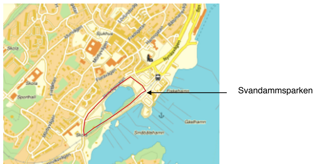
Figur.3 Parken har en naturlig avgränsning åt alla håll, själva formen är avlångt rombformad och på ena sidan går en större väg och på den andra sidan järnvägen och hamnen.

Under våren 2012 genomfördes en enkätundersökning av Nynäshamns kommun, anledningen till undersökningen var att ta reda på hur de olika grönområden som finns i kommunen används av invånarna och hur de uppfattas. Där framkommer det att Svandammsparken hamnar på en tredje plats över stadens mest välbesökta och populära grönområden. Den besöks framförallt för att den rent geografiskt ligger nära bostaden, den vackra naturmiljön, lek, spel och aktivitet, men även möjligheten till avkoppling är viktiga argument. En fråga i enkäten var även vilken plats man avser besöka oftare om den rustades upp och blev ännu mera inbjudande, där kommer Svandammsparken högt i rang vilket kan tolkas som att underhållet i parken är undermåligt eller utförs på ett felaktigt sätt (Nynäshamns kommun 2012 "Enkät" s.1).