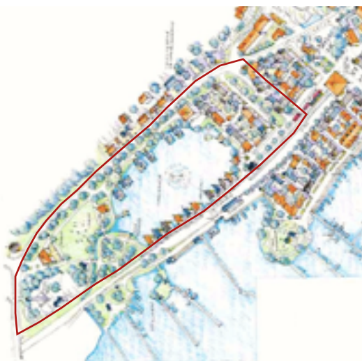
Figur. 4 Kommunens exploateringsförslag över Svandammsparken.

Kommunen skriver i sin översiktsplan ”Genom miljömedveten arkitektur och med en plan för bevarande av kulturhistoriska miljöer kan staden bli än mer attraktiv” (Nynäshamns kommun översiktsplan 2012 s.122). Vidare hänvisar de angående exploatering och byggnation till planen ”Nya Nynäshamn 2014 Staden vid vattnet” där det beskrivs hur kommunen föreslår en rad förändringar i parkområdet. De förespråkar byggnation av bostäder på parkområdets stora gräsytor, deras vision är att området skall bli en ”integrerad del av centrum” . Vidare föreslås även byggnation mellan dammen och järnvägen, grusvägen som finns där i dag betecknas som ”ogästvänlig” och skulle i samband med en exploatering i området bli ett ”attraktivt promenadstråk” . Exploateringen av dammens ”ogästvänliga baksidor” skulle utmytna i ”unika boendekvaliteter” . Avslutningsvis så skriver kommunen att ”Alla stora träd behålls liksom Göstas Park” (Nya Nynäshamn 2014 s.54). Kommunen har genomfört geologiska undersökningar angående markens sammansättning och rasrisk. Även bullerundersökningar över området har gjorts i samband med exploateringsförslaget. Däremot omnämns ingen kulturhistorisk analys av parkområdet i den förstudien.