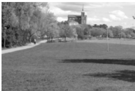
Figur. 9 Den asfalterade västra gångbanan i dag.

Bättre bemedlade borgare från Stockholm ämnade besöka Kuranstaltens havsbad i förhoppning om återhämtning från huvudstadens alltmer urbaniserade och stressande tillvaro. Damer och herrar sågs ofta flanera längs denna grusstig invid Svandammen. Det låg i tiden att röra på sig. Därmed byggdes gångstråk och vägar ut på ett flertal platser i Nynäshamn (Norberg, Gunnar (red.1996) s.30). Norberg beskriver även hur de Olympiska seglingarna som ägde rum 1912 bidrog till att vägar och gångstigar byggdes ut vilket genererar ett högt samhällshistoriskt värde till platsen. Svandammsområdet brukas av både lokalbefolkningen och besökare, människor tar platsen i besittning och gör den till en samlingsplats.