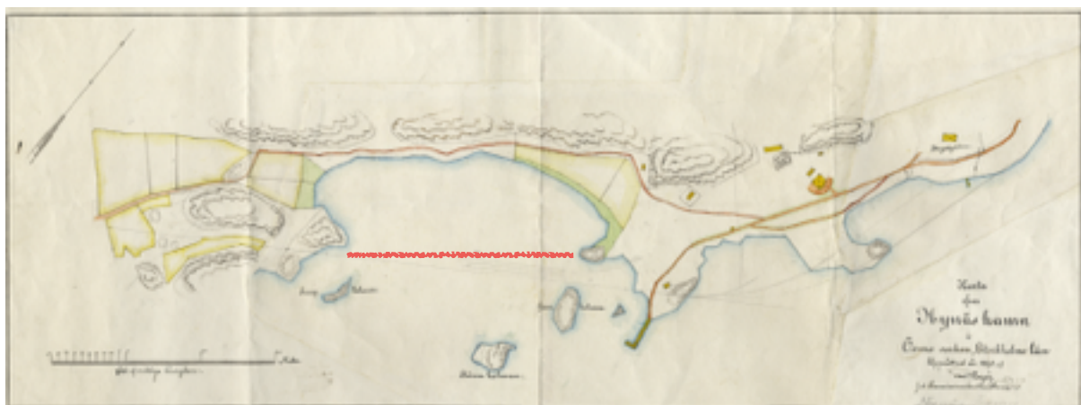
Figur. 5 Karta över Svandammsområdet 1898 innan dammens tillkomst, den röda markeringen visar järnvägens dragning, vilket leder till dammens tillkomst.