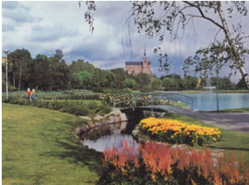
Figur.15 (vykort) Parken med Nynäshamns kyrka i bakgrunden, vykortet är från 1970-talet.

Förklaring: Upplevelsevärde är ofta av skilda slag, vid förväntan och kanske även där varierande minnen spelar in kan upplevelsen vara olika för olika personer. Gemensamt är dock närheten till det som en gång varit och känslan för det förgångna. En tillhörighet och en identitet för platsen.