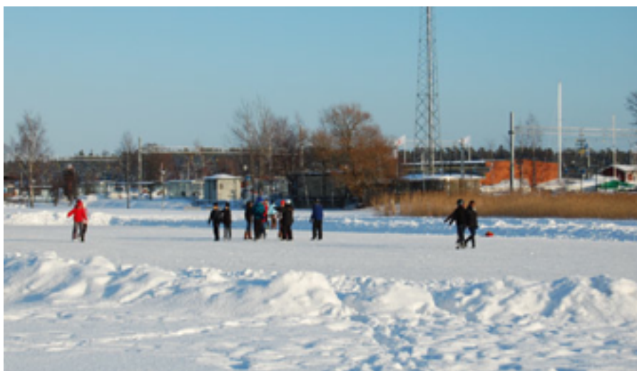
Figur. 11 Skridskotur på Svandammens is, svandammen har vintertid använts som skridskobana sedan den tillkom i början av 1900-talet.

Förklaring: Socialhistoriskt värde kan sammanfattas med olika situationer i samhället som skapats och berättas av människan. Med kontinuitet i detta hänseende menas avtrycket på miljön som människan åstadkommit. Både historiska avtryck och senare brukande av en plats bildar tillsammans en kulturhistorisk kontinuitet. Detta kan avspeglas i återkommande evenemang som äger rum på platsen vilket bildar ett tidsdjup och en känsla av gemenskap och identitet med miljön.