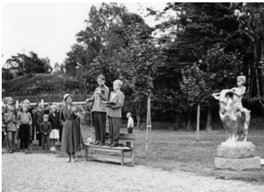
Figur.12 Skolavslutning vid Svandammsskolan i slutet av femtiotalet. Till höger i bild syns skulpturen "Hanseman" av Lars Andersson. (stulen i mitten av 2000-talet.)

Förklaring: Traditionellt firande som är återkommande och knuten till en plats. En tradition kan förklaras som en händelse som upprepas kontinuerligt under tid.