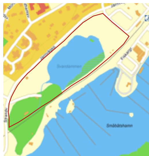
Figur. 3 Svandammsparkens avgränsning i dag markeras av den röda linjen.