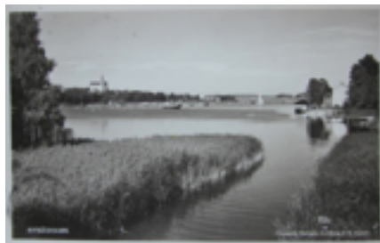
Figur. 2 Gammalt vykort över Nynäshamn med parken som förgrund och kyrkan i bakgrunden.

I början på 1900-talet var det mest välbärgade storstadsbor från hela Europa som besökte området, den var genom sitt läge en naturlig genomfart till den kur- och badort (Trehörningen) som på den tiden besöktes av välbärgade Stockholmare som behövde vila upp sig. Under hela 1900-talet har området använts som en naturlig samlingsplats kring olika aktiviteter, under vinterhalvåret har man åkt skridskor på den frusna dammen och på sommarhalvåret har områdets gräsytor inbjudit till olika sociala aktiviteter (Norberg, red. 1996 s.103), (Larsen, 1969 s.34). Växtligheten bestod från början mest av lantligt barrskogslika områden, en del av de granar som funnits där sedan dammens tillkomst för över hundra år sedan finns fortfarande kvar och det finns ett skriftligt avtal i kommunens visioner om att dessa även i framtiden ska bevaras (Nya Nynäshamn 2014 s.54).