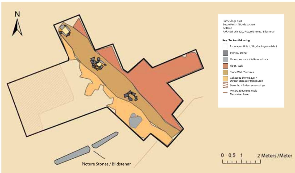
Plan över utgrävningsschaktet vid BUTTLE ÅNGE. Digital planritning Linnea Lövgren och Maria Lönnegren.

Ovanför det sterila orörda lagret i botten visade sig schaktet bestå av ett mycket omrört mörkfärgat lager med en mängd moderna föremål. I schaktets nordöstra ände påträffades rester av en stenlagd husgrund, som ännu inte daterats men troligen är medeltida eller tidigmodern. Husets grundmur löper från sydost mot nordväst och avståndet från den mindre av de två bildstenarna är cirka 1,5–2 meter. I direkt anslutning nordost om grundmuren framkom en flat stensatt yta som kan tolkas som stenläggning för ett golv. Hela husgrunden kunde tyvärr inte grävas ut på grund av tidsbrist.