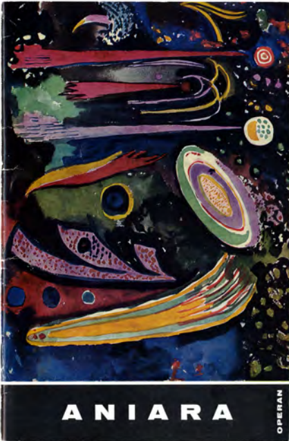
Sven "Xet" Erixsons omslag från Operans program till uruppförandet till Aniara 1959. Musiken skrevs av Karl-Birger Blomdahl. UUB, signum H.Martinson 163.