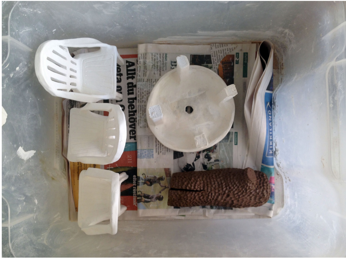
Ting på tork