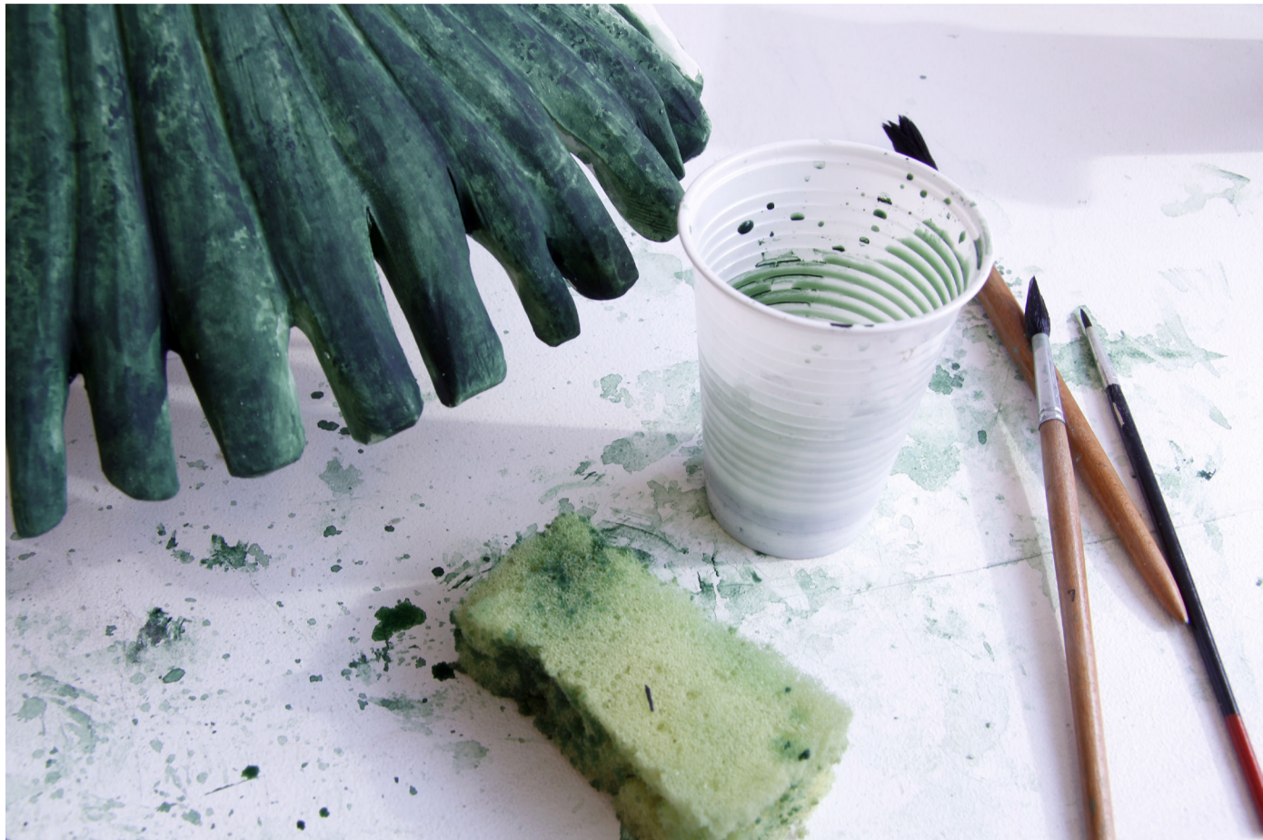
Färgprov med akvarell och tusch