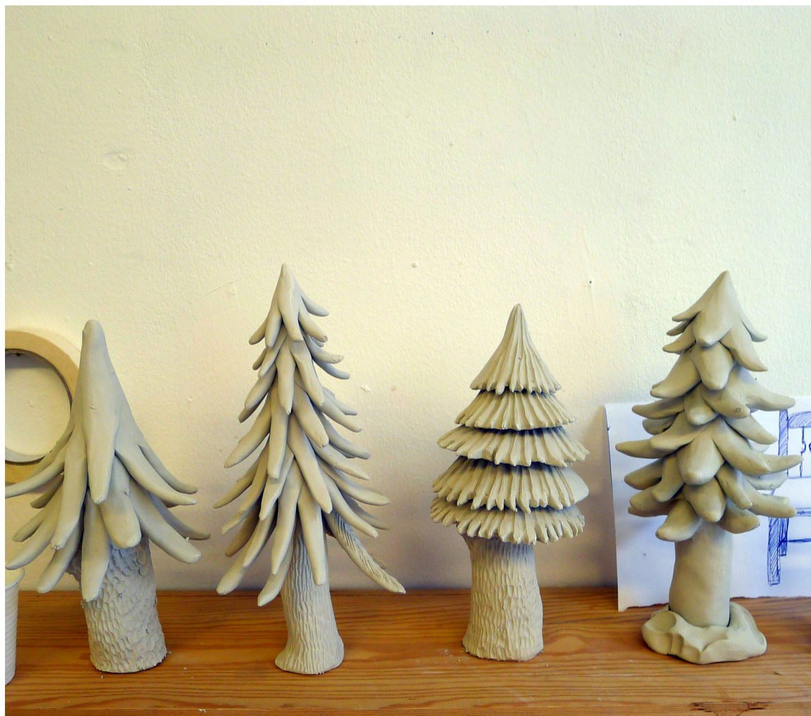
Prov på granar

Jag vill jobba med symboler, liknelser och form som avbildar vardag men ändå inte når fram till en superrealism. Objekten som kommit till är inte i proportion till varandra och detta bestämdes redan innan byggandet sattes igång. För att få en variation och en rörelse i samlingen av objekten tycker jag att de olika storlekarna gör sig bra. Det tar ännu ett steg ifrån den verkliga verkligheten men försätter fortfarande att avbilda faktiska ting. När de står tillsammans blir det något mer än en uppställning, ett dockhus eller rekvisita till något annat. Skevheten kommer in än en gång, inte bara genom formen utan nu också genom förhållandet mellan objekten.