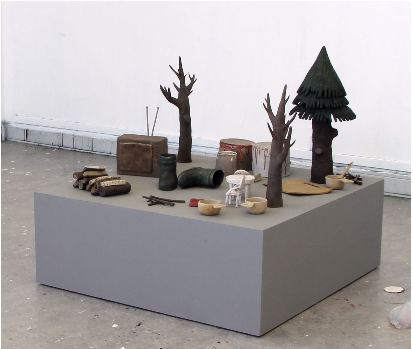
Total storlek ca 120 x 120 x 140 cm