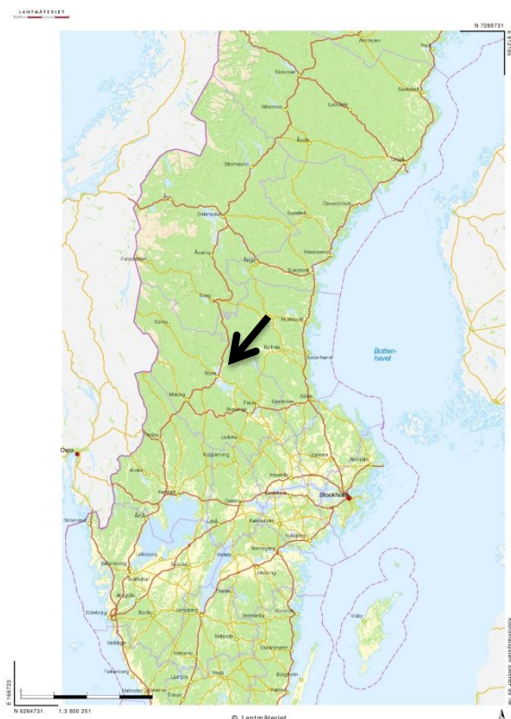
Figur 1: Skattungbyn i Sverige. (Lantmäteriet.se)

I denna uppsats har vi valt att prata i termer av gröna livsval och grönare liv eftersom det inte i lika stor utsträckning som hållbarhetskonceptet eller miljövänligt syftar till att mäta eller påvisa graden av mänsklig påverkan på den omgivande miljön. Med gröna livsval menar vi medvetna val i en miljömässigt hållbar riktning. I den grad vi nämner hållbarhet syftar vi främst till de miljömässiga aspekterna av hållbar utveckling. Som med alla kategoriseringar och koncept så bär de med sig en rad olika egenskaper som förknippas med dem och gör de mer eller mindre lämpliga att använda i olika sammanhang. Vad som är ett hållbart eller miljövänligt liv för mänskligheten i stort är en diskussion som sträcker sig utanför ramen för denna uppsats.