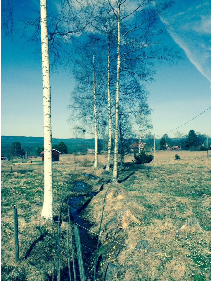
Figur 6: Bäck mellan odlings- och betesmark inne i byn. I bakgrunden syns utsikten mot skogsbältet Finnmarken.