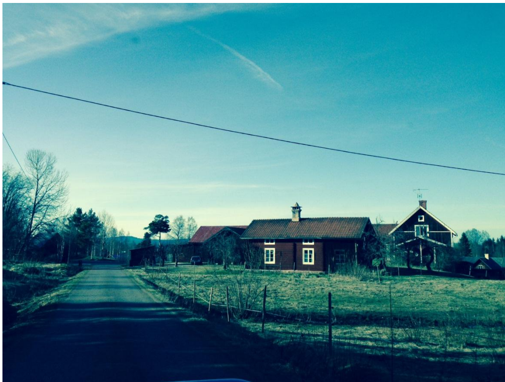
Figur 5: Smala vägar mellan bostäder. I Skattungbyn går det ett nät med vägar mellan husen och det är lätt att gå eller cykla.

kulturliv. Att det skapar starkare sociala relationer. Det kulturliv som finns skapar invånarna själva till stor del. Bea tycker samtidigt inte att det är särskilt långt till städer. Det går snabbt med tåg och buss. När Bea flyttade till Mora tyckte hon att det var en håla. När hon nu bor i Skattungbyn är Mora city.