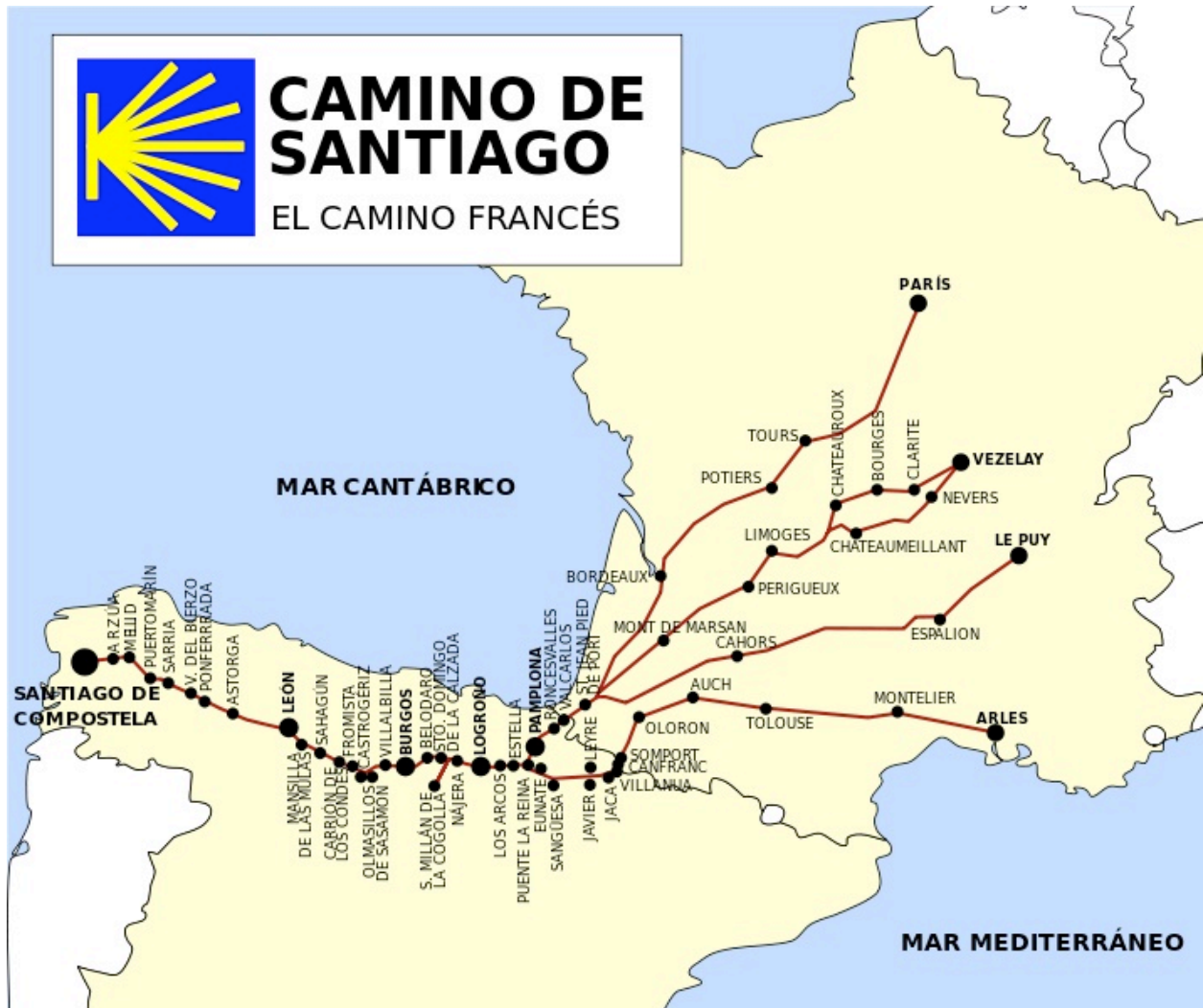
Camino Français genom Frankrike och Spanien