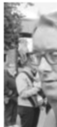
Migrationsminister Tobias Billström besöker Öland fredagen.

– Vi har tidigare varit med om att väldigt många romer kommer till Sverige på en gång, ofta därför att de har blivit lurade. Det som sker nu är att deras ansökningar ska hantearas, det handlar om ett par veckor innan detta arbete är avslutat, säger Tobias Billström.