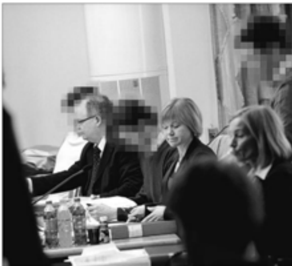
BERÄTTADE, 39-åringen som erkänt att det var han som slog Esa Rano i huvudet med en yxa berättade utan ånger om "Efter första slaget med vassa sidan så ramlade ena ögat ut", sade 39-åringen (stämde till höger i bilden).

Jag vill markera att han skulle sluta skameras om. Han skändade också vår mor med olika ord. Han har ju beaktat förbud också och där har vi ju juristbyråer, sa 39-åringen till Mats Enbom, Åkeris.