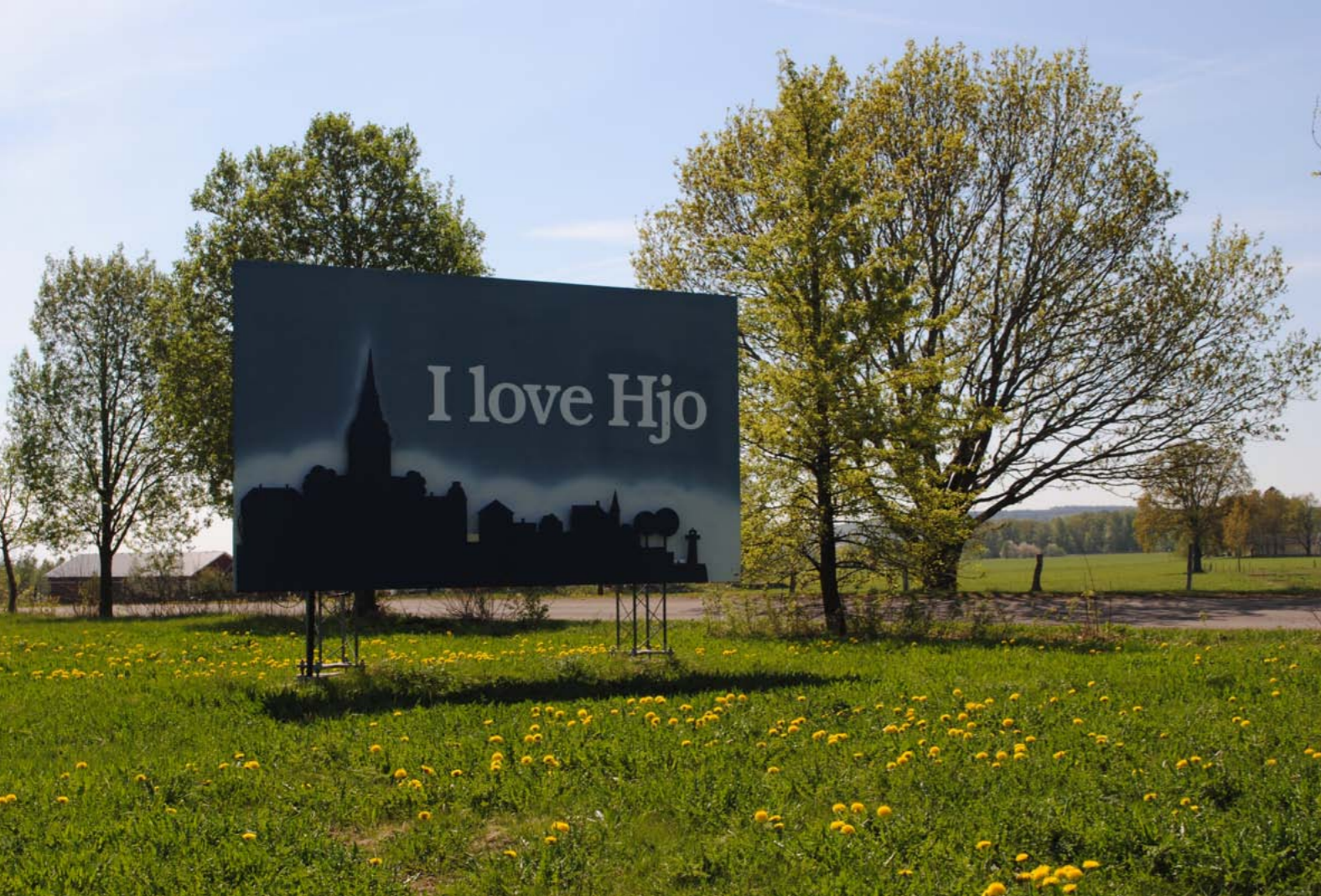
2009 beviljade leader en halv miljon kronor för att undersöka möjligheterna att bygga en saluhall i Hjo. Men man kunde inte enas om en placering så projektet lades ner i förtid.