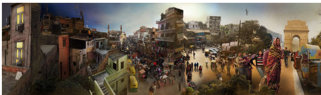
Den långa bilden (Något beskuren)