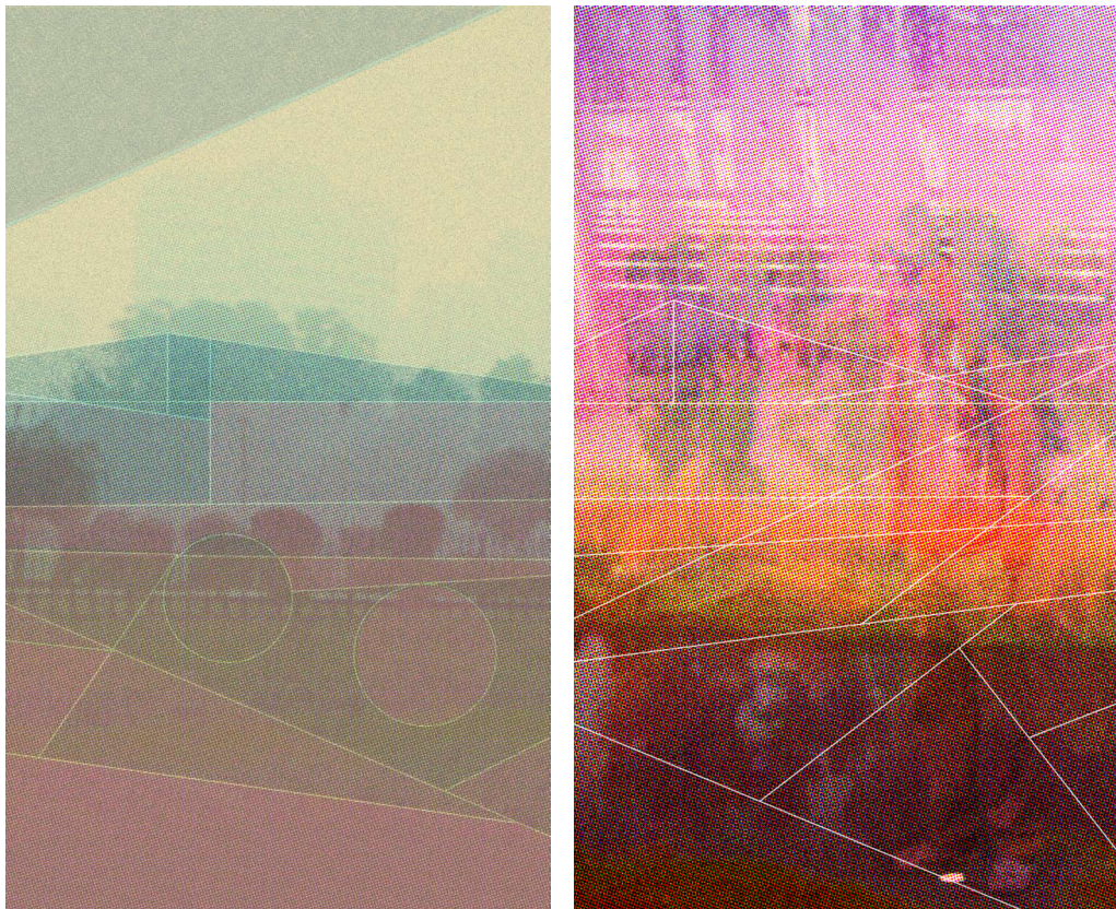
Experiment med bilder utifrån ett grid skapat från den långa bildens sidor.

Jag arbetade med att skildra min resa. Minnet av den. Genom den långa bildens drömska bildminne. Genom ord, återberättande av personliga minnen. Och slutligen, genom de konkreta objekt jag tagit med mig från resan. Mina fotografier.