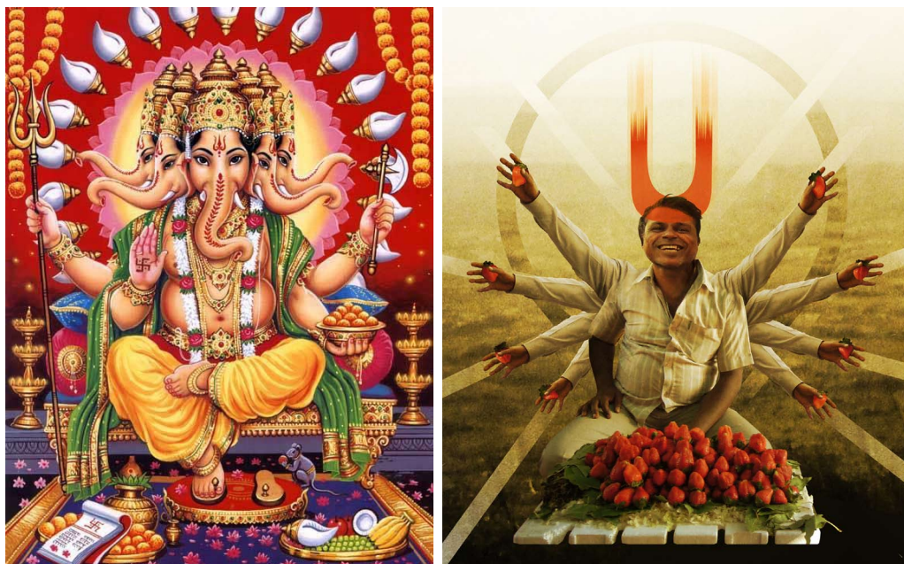
Indisk gudabild och min skiss till uppdaterade gudabilder.

en utvickningsbar tablå utifrån landskapet runt resestappen och följas av olika skilda teman, fritt återgivet, från fakta och fiktion jag läst och samlat på mig. Jag ville berätta om kaoset i Delhi genom Arvind Adigas The white tiger . Jag ville berätta om Rishikeshs övergivna gamla ashram genom Beatleslåtar skrivna där. Jag ville berätta om Rajasthans gamla palats och tempel med hjälp av historieböckerna. Och jag ville måla upp Bombays slum med hjälp av Gregory David Roberts Shantaram . Jag ville blanda citat och egna texter med foton och gamla målningar i en egen ihopsatt helhet. Jag började skissa och arbeta utifrån en idé om att skildra det moderna Indien med sin egen bildtradition. Jag ville göra uppdaterade gudabilder inspirerade av de kitschiga planscher som säljs överallt på gatorna i Indien. Nutida människor med allt vad det innebär i fråga om fattigdom eller statusföremål med uppdaterade gudasympboler och attribut.